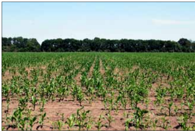
Според специалистите за пролетниците вече няма опасност и реколтата ще бъде добра.

В общините Тервел и Добричка през април и май са пад-