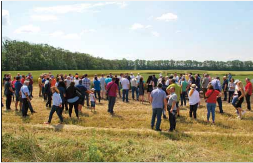
Много хора, тясно свързани със земеделието и науката уважиха юбилейния празник, който включваше и посещение на опитните полета.

В изборите за парламент ще участват 23 формации от отделни партии или коалиции, а избирателите с право на глас за вота са 6 711 048 по данни от ГД „ГРАО“ към МРРБ. Всеки избирател може да направи справка за номера и адреса на избирателната си секция на интернет страницата на ГД „ГРАО“ към МРРБ.