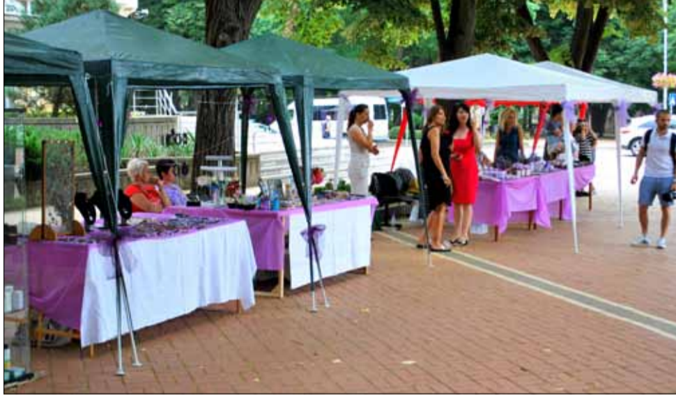
Това е снимка от последния Фестивал на лавандулата, който се проведе в град Генерал Тошево през 2019 година. Сега организаторите обещаваат събитието да бъде още по-мощно.

В България вече има общо над 136 000 дка, засадени с лавандула, като средният годишен добив е над 51 000 тона, а това нарежда страната ни на първо място в света.