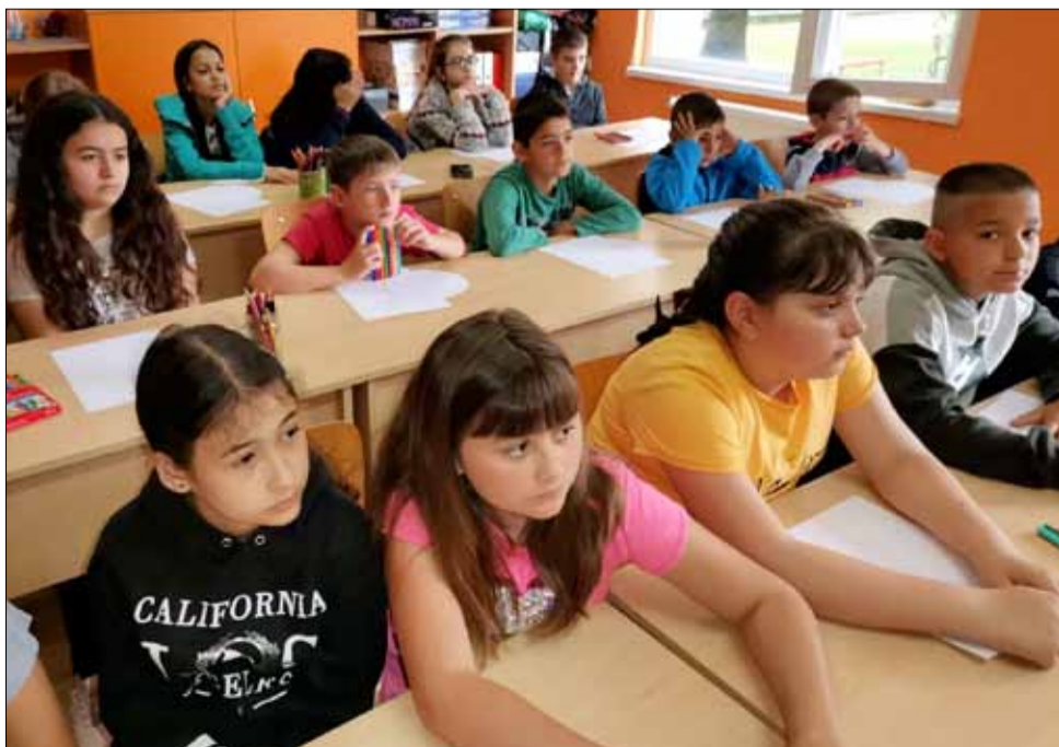
Образователен урок в патиланското царство.

Наравно с всичко това игрите и четенето на книги от задължителната литература не останаха на заден план, а всички деца вече очакват с нетърпение новите изненади и занимания, които са им подготвени за следващите дни.