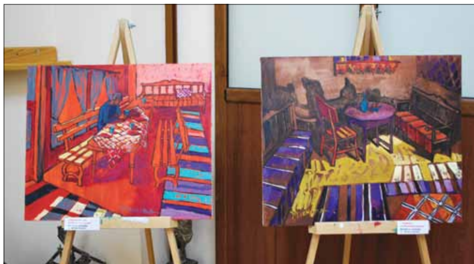
Картините от пленера по живопис впечатлиха много от посетителите на изложбата.

забележимо присъствие; създаване на нови художествени произведения, които да попълнят фонда на Община Генерал Тошево с творби на живописиста. Цели се също да се популяризира община Генерал Тошево като място с атрактивна природа, богато културно-историческо наследство, жизнено настояще и възможности за бъдещо развитие.