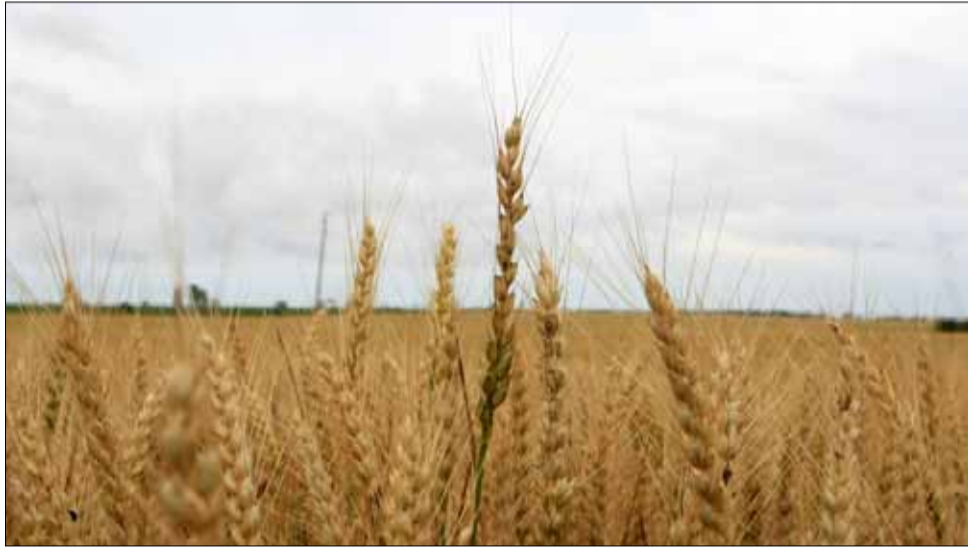
Жътвата на пшеница в община Генерал Тошево вече започна.