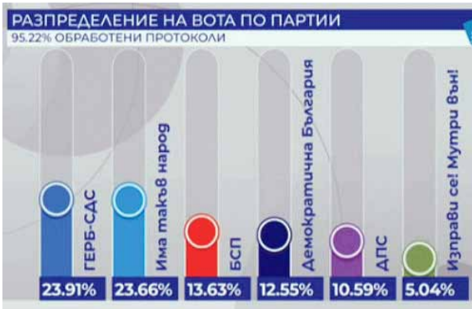
Както през април, така и сега, място в новия парламент намират шест политически формации.

Официалните резултати трябва да бъдат обявени до 4 дни – най-късно на 15 юли, а имената на избраните за народни представители – най-късно на 18 юли. След това президентът Румен Радев трябва да свика първото заседание на новоизбрания 46-и парламент, на което обикновено се избира ръководството му. Срокът по конституция е до месец след изборите - т.е. до 11 август, но очакванията на партийните централи са, че държавният глава няма да бави свикването на депутатите. Неофициално като най-вероятна се спомежава датата 22 юли.