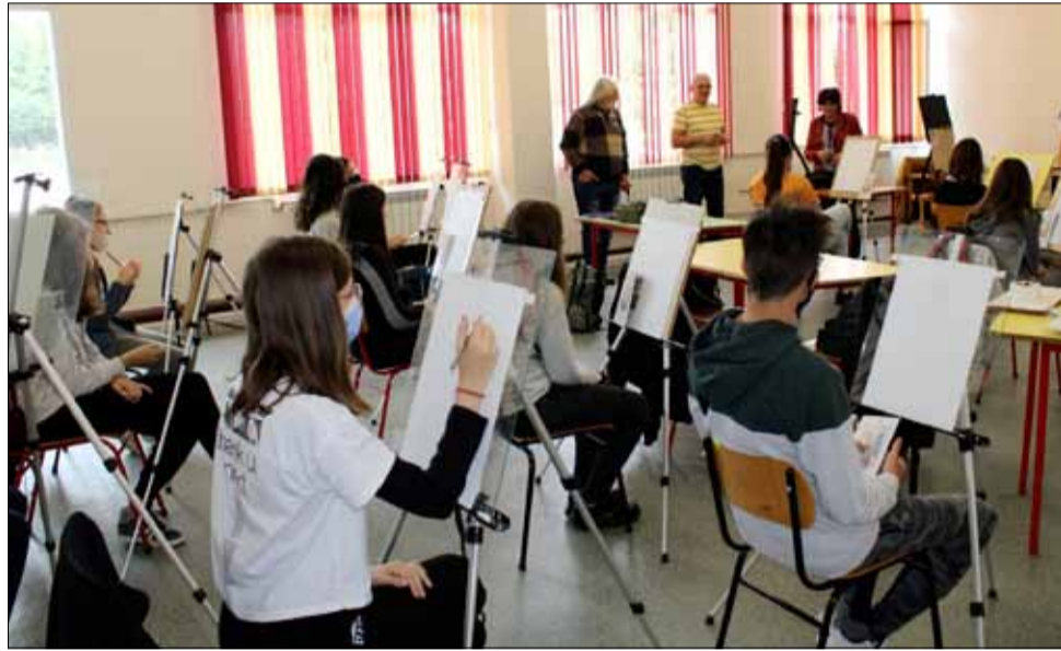
Клубовете по музика и рисуване предизвикаха огромен интерес сред учениците.