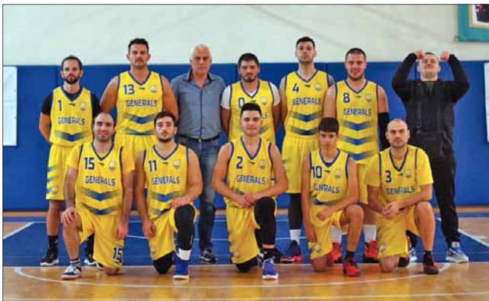
Това е мъжкия отбор на „Спортбаскет – ГТ“, който през този сезон ще играе в „Б“ Група на Зона „Изток“ в ББЛ.

Във временното класиране лидер в групата е отборът на „Шоутайм Б“ (Варна), следван от „Ънстопабъл Б“ (Добрич). И двата състава са с пълен актив от 4 точки след две победи. „Спортбаскет – ГТ“ е на шесто място с 3 точки от една победа и една загуба само заради по-лошата си точкова разлика, спрямо тимовете на „Консуматорите“ (Варна), „Олд Файв“ (Варна) и „Черноморец“ (Балчик), които са съответно на трето, четвърто и пето място със същия точков актив. На последните две места са „Светкавица Б“ (Търговище) и „Калиакра“ (Каварна).