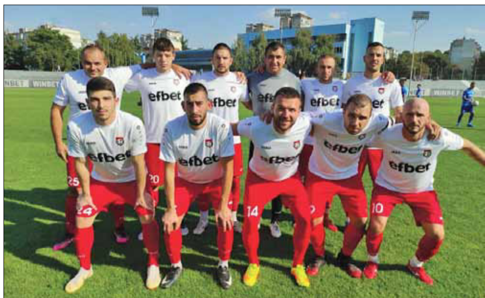
Архивна снимка на ФК „Спортист – 2011“.

С прибавената 1 точка отборът на „Спортист 2011“ запази деветата си позиция с актив от 12 пункта. В следващия кръг – на 13 ноември (събота) от 14:00 часа на „Спортист 2011“ предстои ново тежко гостуване – този път в Нови пазар на местния „Ботев“.