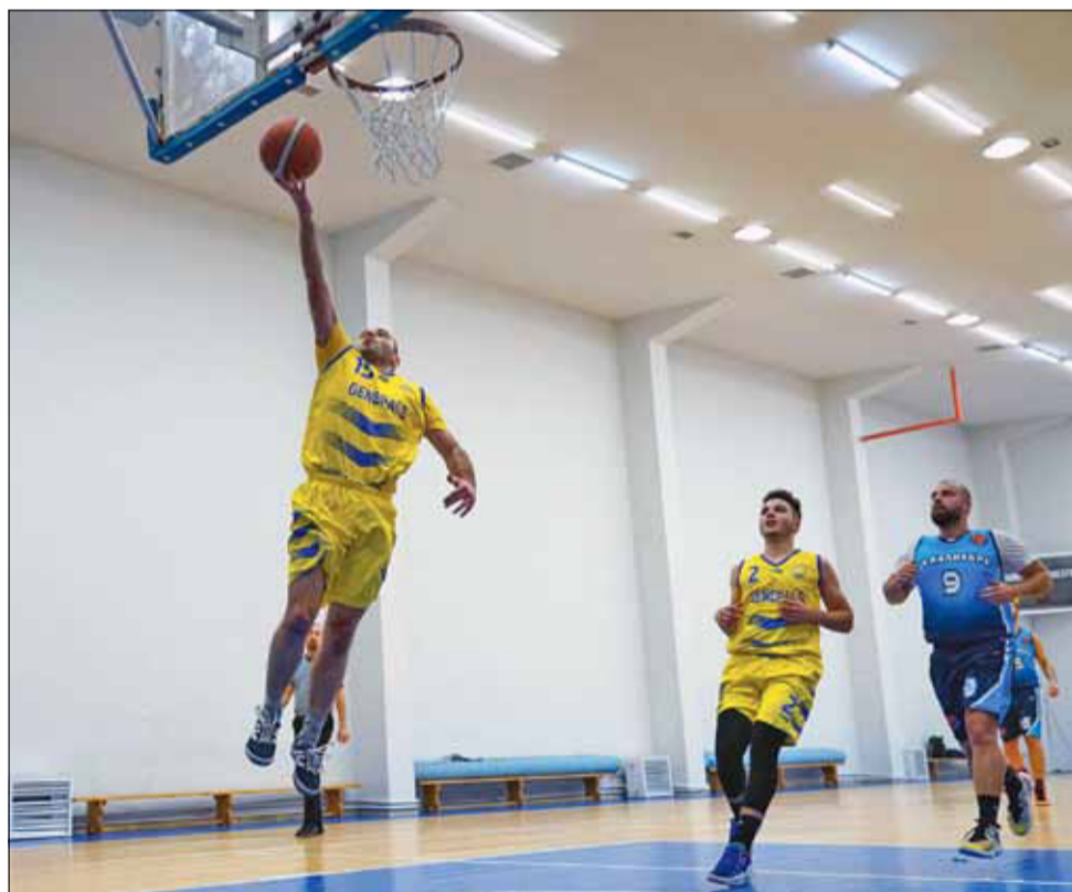
Домакински успех над „Калиакра“ за „Спортбаскет – ГТ“ в първенството на ББЛ.