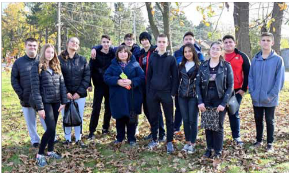
Всички младежи, които участваха в хубавата инициатива.