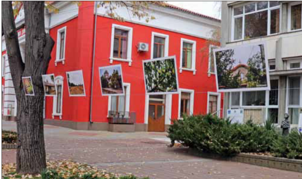
Изложбата представя страхотни фотоси от есенната красота на нашия роден край.

Основната идея на пленера, който е ежегоден, е той да се превърне в празник на изкуство – своеобразна среща на фотографите с природата и бита на Иовковата Добруджа, която да ги вдъхнови да претворят във фотоси красотата във всички нейни форми и проявления.