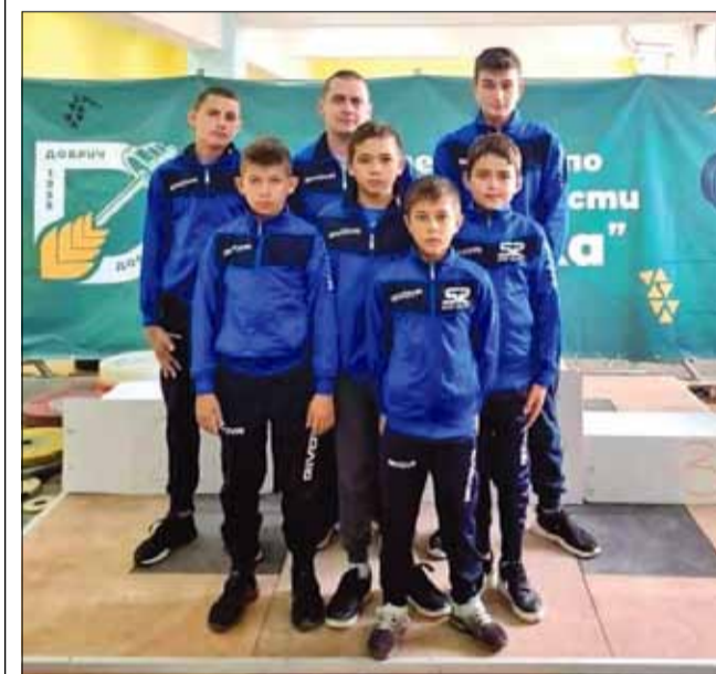
Отборът на СКВТ „Генерал Тошев“, който завоюва бронзовите медали в отборната надпревара.

След шестата загуба през този полусезон отборът на „Спортист 2011“ остана на десетото място във временното