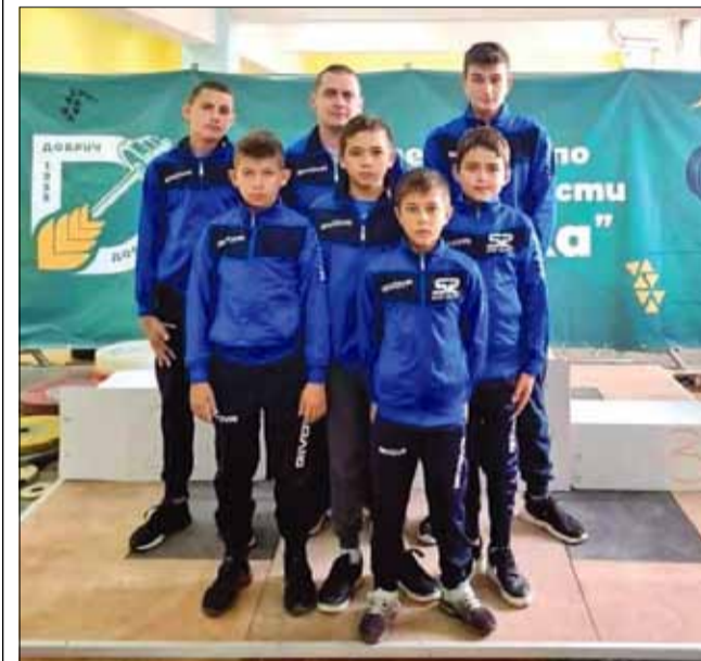
Отборът на СКВТ „Генерал Тошев“, който завоюва бронзовите медали в отборната надпревара.