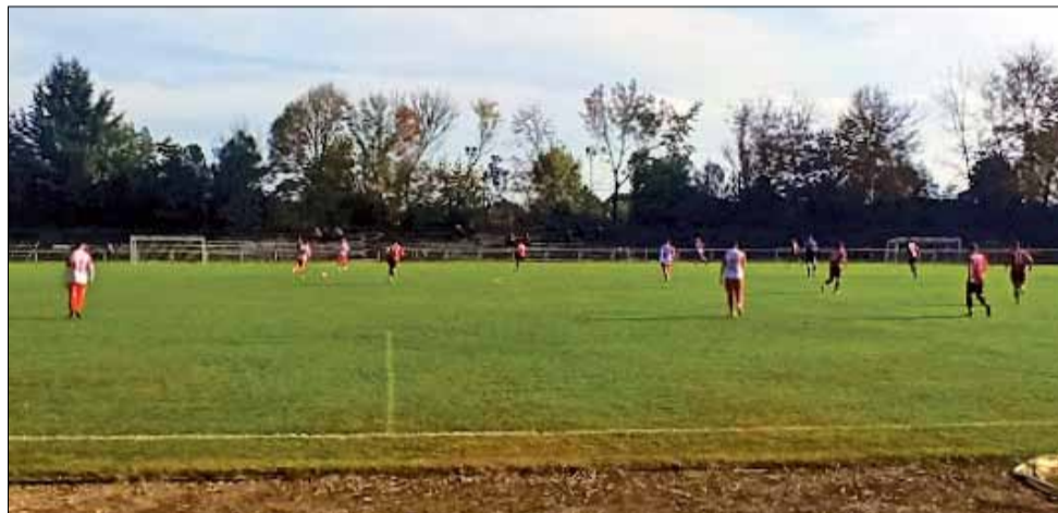
До Нова година отборът на „Спортист 2011“ ще трябва да изиграе още един двубой – отложенният срещу „Устрем – Д“ (Дончево) на 12 декември.

ражение с 0:3 от гостуващия „Септември“ (Тервел) и по този начин ще зимуват на десетото място във временното класиране с актив от 12 точки.