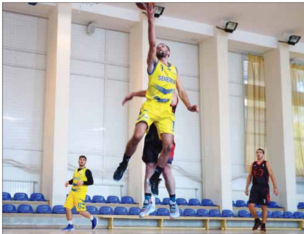
„Спортбаскет – ГТ“ отстъпи на по-силния си съперник във Варна.

брич), който е с пълен актив от 10 точки след 5 победи в 5 двубоя. Именно срещу „Ънстопабъл Б“ е следващата среща на „Спортбаскет – ГТ“.