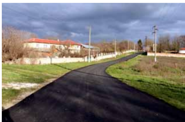
Община Генерал Тошево може да се похвали с изпълнението на редица мащабни инфраструктурни проекти през тази 2021 година.

превенция на различни заболявания на деца и възрастни хора в риск. Така може да се стигне до всеки жител на общината, който е в нужда и беда.