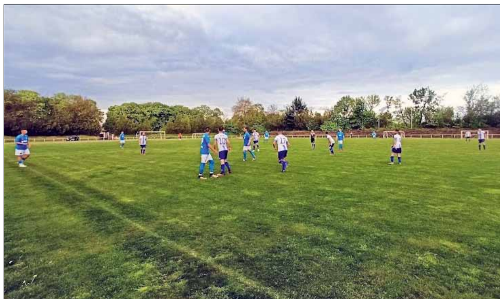
Отборът на „Спортист“ успя да победи тима на „Калиакра – 1“ в изключително оспорван и драматичен двубой. Седмица по-късно „Спортист“ победи и „Партизан“ в село Василево.

До края на надпреварата остават точно два кръга, в които „Спортист“ ще се опита да спечели максимален брой точки в опит за класиране в Топ 4. „Партизан“ и „Дружба“ пък си остават закотвени на последните две места в групата, но в края на тази седмица – на 14 май (събота) от 18:00 часа си дават среща в село Люляково в едно най-чаканите местни дерби на територията на нашата община.