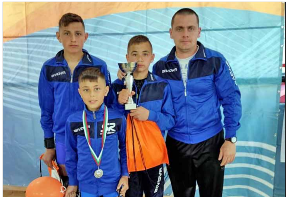
Това е отборът по вдигане на тежести, който се завърна с бронзов медал от „Купа Русе“.