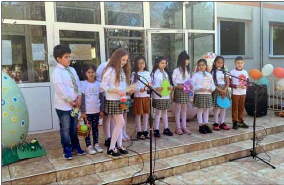
Активните занятия през пролетта в ОУ „Хр. Смирненски“ нямат край.

На 21 април, за втора поредна година в ОУ „Христо Смирненски“, град Генерал Тошево се проведе Великденският фестивал „Шарено яйце“. С много песни, игри и танци училищният двор беше огласен в хубавото време. За всички учители, ученици, родители, приятели и съмишленици това беше едно вълнуващо преживяване, на което всички заедно като едно цяло семейство, посрещнаха един от най-светлите християнски празници.