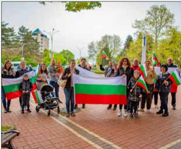
Много български знамена и планети имаше на протеста за мир и неутралитет на страната ни.

Решението на Народното събрание предвижда България да окаже военнотехническа помощ на Украйна, която