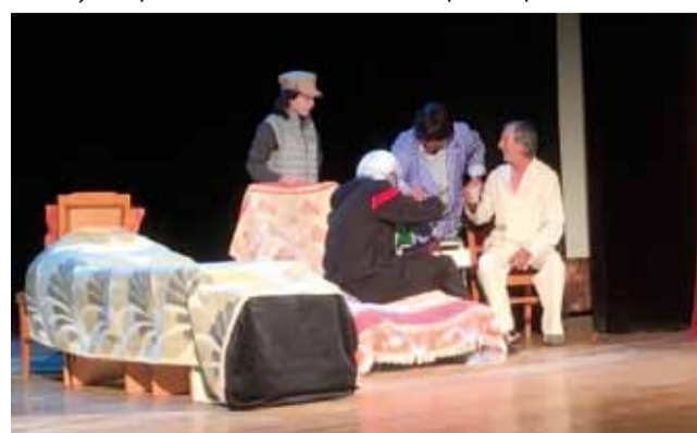
Самодейците от нашия град изиграха още едно страхотно представление.

Абсурдната трагикомедия беше изиграна по великолепен начин от нашите самодейци, които успяха да докарат до сълзи от смях публиката и да заслужат продължителни аплодисменти в края на представлението.