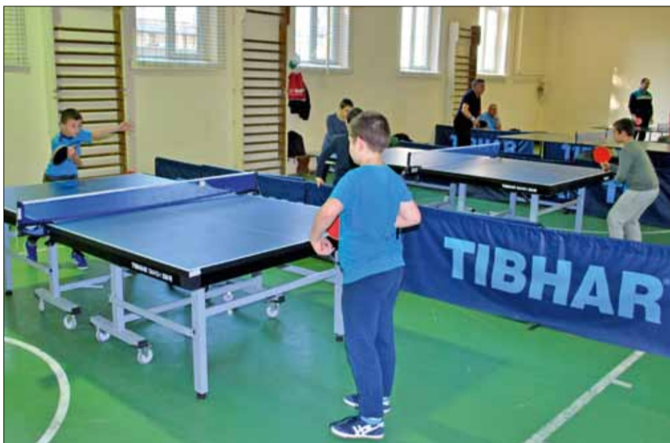
Тенисът на маса е един от любимите спортове на нашите съграждани и поради тази причина отново фигурира в програмата за Седмицата на спорта.