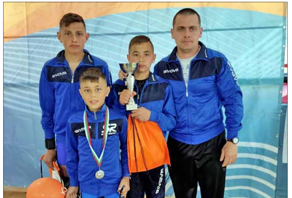
Това е отборът по вдигане на тежести, който се завърна с бронзов медал от „Купа Русе“.