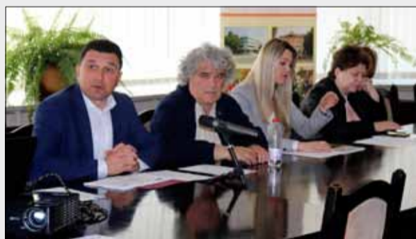
Момент от заключителната пресконференция по проект „Развитие на туристическия потенциал, опазване и популяризиране на общото наследство“.

В рамките на финалното публично събитие екипите на страните партньори представиха пред медиите и обществеността дейностите по реализиране на проекта. От българска страна те включваха основни ремонти на сградите на НЧ „Отец Паисий - 1897“ - село Спасово, и НЧ „Пробуда - 1941“ - село Кардам, както и благоустрояване на прилежащото пространство на историческия музей в град Генерал Тошево. Гостите от Мурфатлар също споделиха своя принос за изпълнение на проекта, ка-