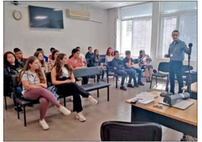
Образователните уроци в Районния съд винаги са били интересни и посещавани.

та при използването на интернет и социалните мрежи в тяхната възраст за превенцията и възможните реакции срещу онлайн тормоза. По време на лекцията се проведе дискусия между учениците, учителите и лектора. Някои от децата споделиха свои конкретни случаи и опасения при досега им