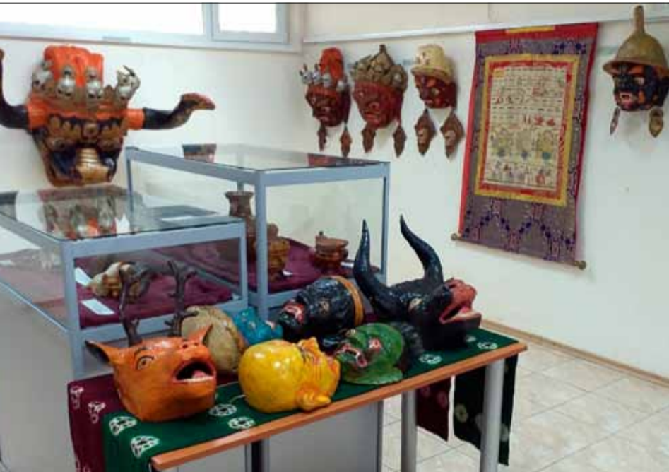
Изложбата „Изкуствата на Тибет“ е изключително интересна и ще бъде открита официално в Нощта на музеите – на 14 май от 17:00 часа.

За допълнителна информация, може да се свържете с нас на посочените телефони: 0879/16 24 00 и 0879/16 24 01.