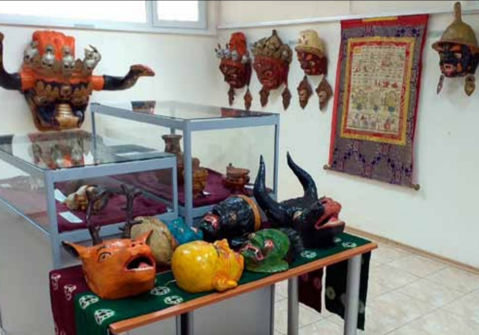
Изложбата „Изкуствата на Тибет“ е изключително интересна и ще бъде открита официално в Нощта на музеите – на 14 май от 17:00 часа.

За допълнителна информация, може да се свържете с нас на посочените телефони: 0879/16 24 00 и 0879/16 24 01.