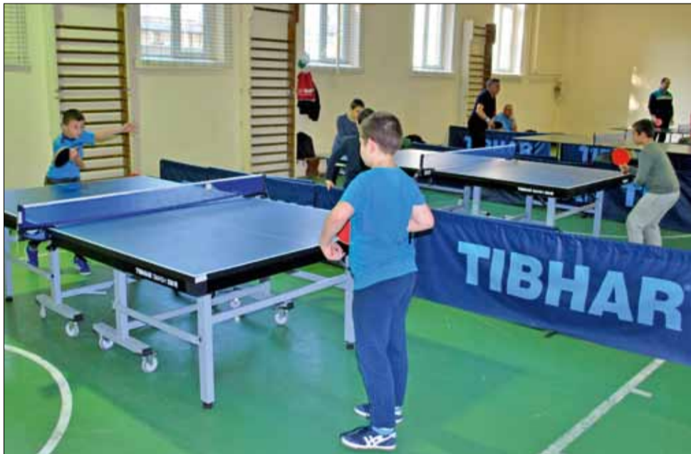
Тенисът на маса е един от любимите спортове на нашите съграждани и поради тази причина отново фигурира в програмата за Седмицата на спорта.