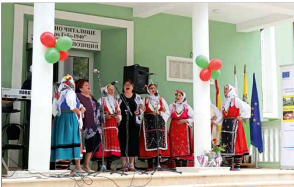
Ремонтираното читалище в село Дъбовик беше официално открито с разнообразна музикална програма.

Основната цел на проекта е да насърчи трансграничното сътрудничество за популяризиране на културно-историческото и природно наследство, както и създаване на условия за устойчиво социално-икономическо развитие и просперитет на черноморските крайбрежни общности.