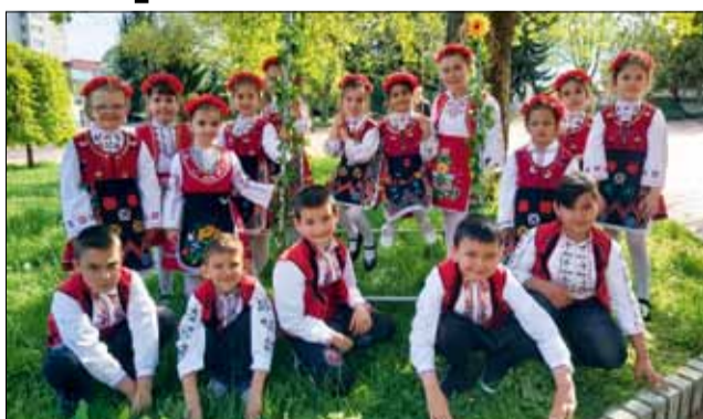
Малки и големи се полюляха на Гергьовската люлка за здраве и благоденствие.

На 5 май в навечерието на Гергьовден малки и големи се полюляха за здраве на пъстра и богато украсена люлка под зелено дърво в центъра на град Генерал Тошево. Това се случи за пръв път от две години заради пандемията, която буквално парализира целия свят.