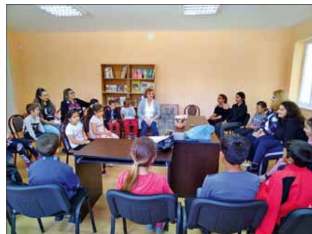
Първи образователен урок в читателския клуб в село Красен.

Юбилейното издание на музикалната проява завърши с великолепно изпълнение на песента „Мило ми е, мамо“ на всички наградени участници, жури и организатори.