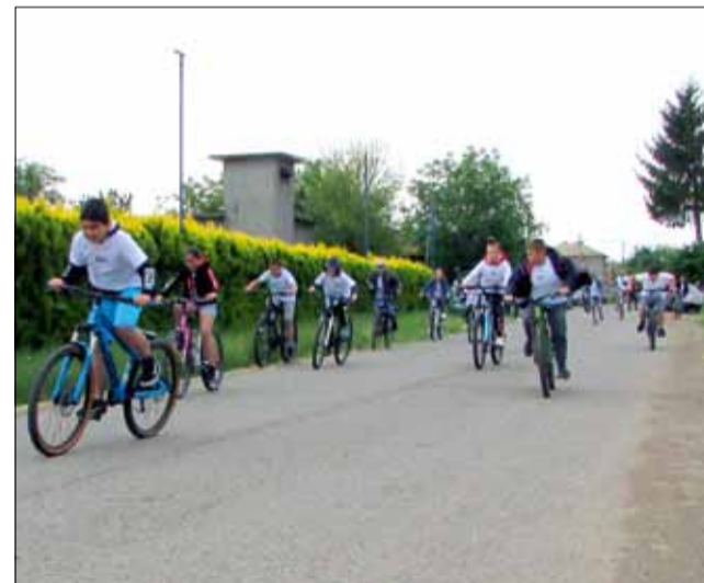
Участниците потеглят с всички сили от старта.

допа) и продължи към квартал Пастир, където участниците обърнаха и се върнаха обратно по трасето. Общата дължина от малко над 3,5 км. не затрудни дори и най-малките ентузиаста, които