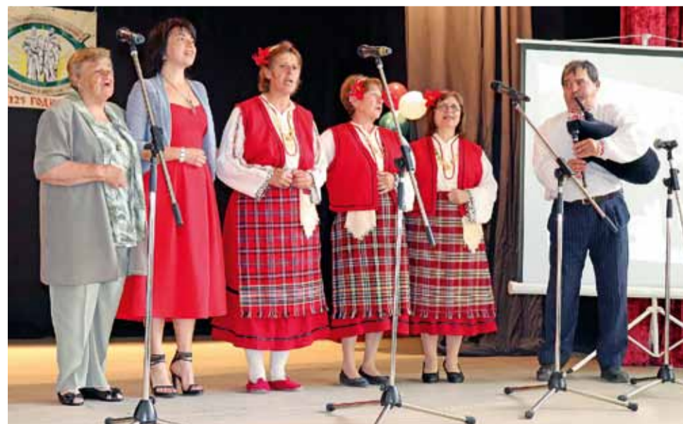
Публиката в село Пчеларово отдавна беше зажадняла за подобни хубави изпълнения.

„Култура, вероизповедания и интеграция“. Свои поздравления поднесоха читалищни секретари и кметове от района.