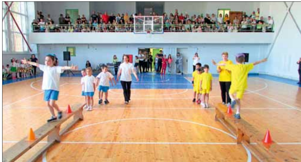
Игрите бяха много вълнуващи и динамични.

В различните игри децата дадоха всичко от себе си, насладиха се на участието си и накрая бяха поощрени с награди. Имаше съревнование, имаше хъс, имаше и спортна злоба. Но накрая победители бяха всички, защото в този ден победи спорта, уважението и спортменството между децата.