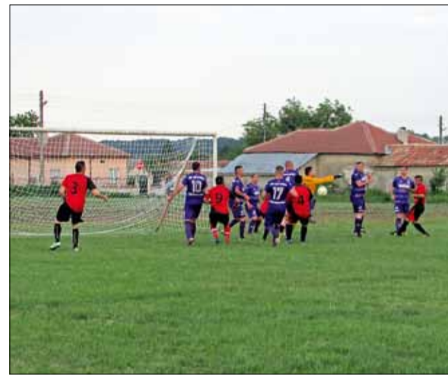
„Дружба“ и „Партизан“ изиграха равностоен двубой, който беше спечелен от домакините.

В друга среща от този кръг „Спортист“ (Генерал Тошево) допусна загуба с 2:3 при гос-