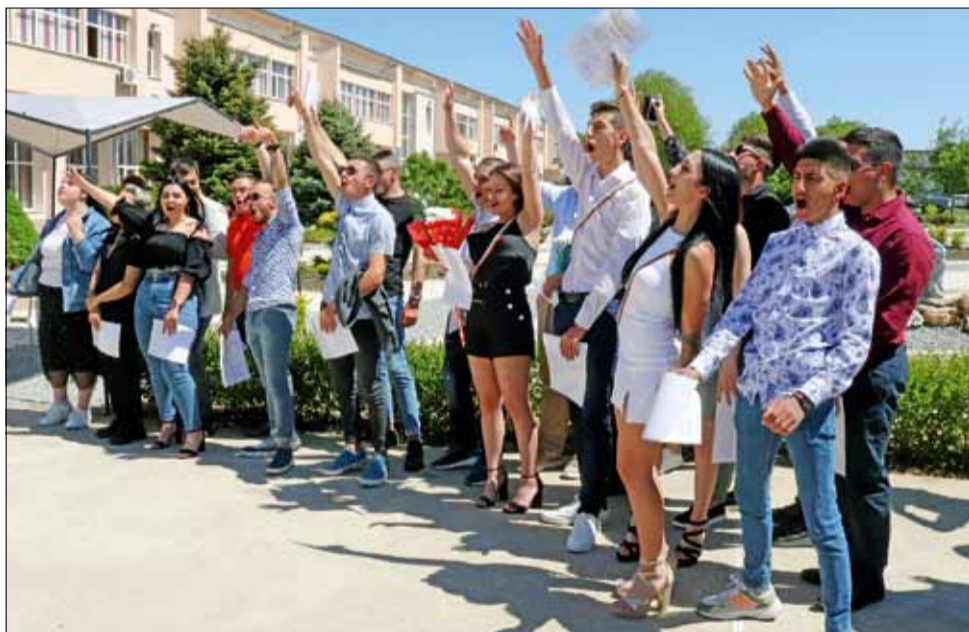
Випускниците на ПГ по земеделие „Тодор Рачински“ броят от 1 до 12.

лищния флаг и националния триколюр на наследниците си и се сбогува завинаги с родното си училище. Любимите им учителки пък бяха затрупани с цветя и целувки.