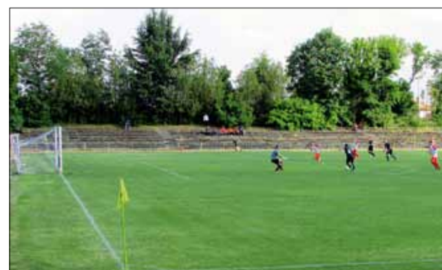
Миг преди топката да влезе за четвърти път в мрежата на „Спортист – 2011“.

В последния кръг за сезона, който ще се играе идния уикенд „Спортист“ е домакин на „Интер“, „Дружба“ гостува на „Албена – 97“, а „Партизан“ приема „Орловец – 2008“.