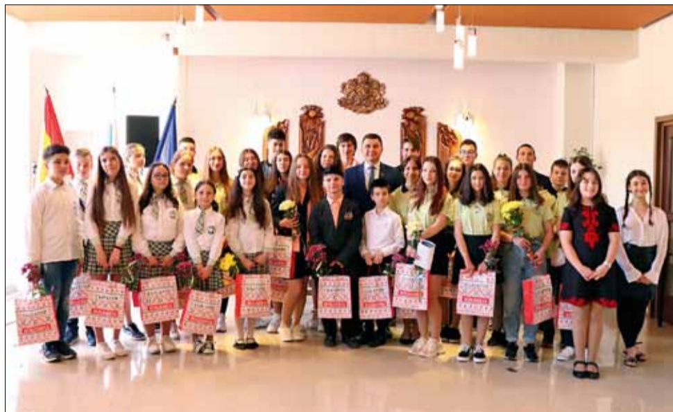
Това са даровитите деца от нашата община.