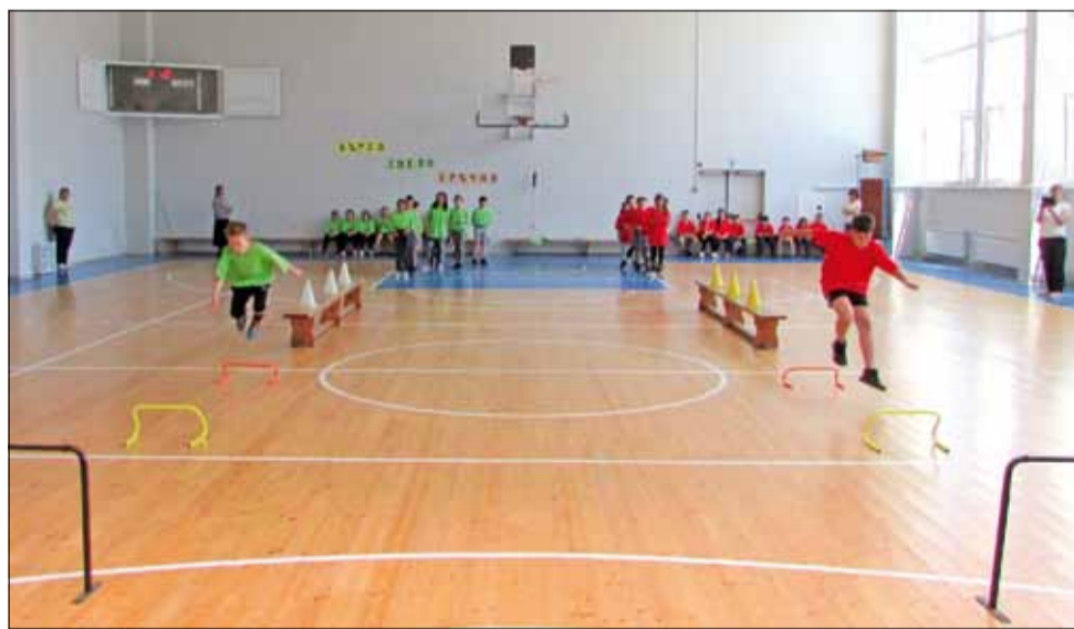
Учениците се раздадоха максимално в името на своите училища.

Затова и организаторите от Община Генерал Тошево обещаха на децата, че „Бързи, смели, сърчни“, ще се превърне в традиция. Учениците от своя страна пък заявиха, че ще продължават да бъдат активни и да спортуват, за да бъдат готови за следващите предизвикателства.