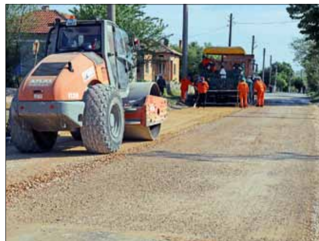
Ремонтните дейности в село Житен.

Предвидените дейности по обекта съдържат направата на изкоп с дълбочина около 1 м., обратен насип с подходяща земна маса, полагагане на нова трошенокаменна настилка с дебелина 50 – 55 см. и изливане на два пласта асфалтова настилка.