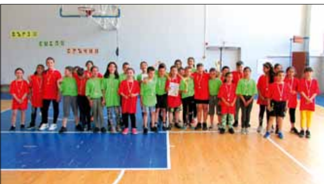
Снимка за спомен на двата ученически отбора в игрите „Бързи, смели, сърчни“.