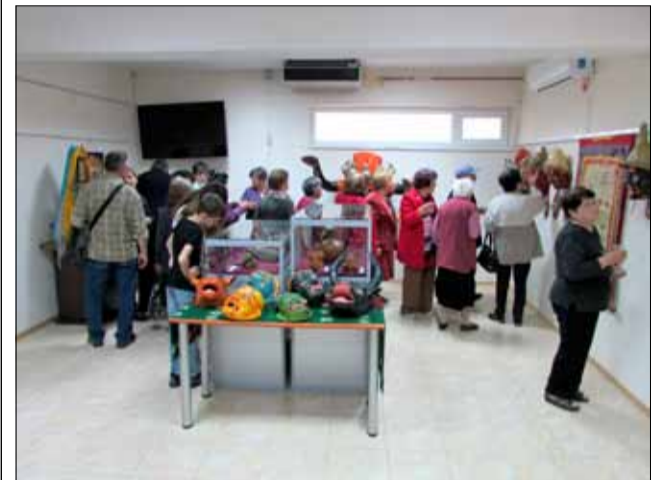
Изложбата в музея предизвика сериозен интерес и беше посетена от над 250 души в деня на официалното и откриване.

Интерес представляват т.нар. танки. Танка е будистка религиозна живопис върху па-