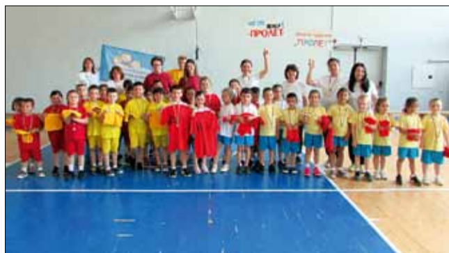
Това са децата от детските градини, които се състезаваха в „Бързи, смели, сърчни“.