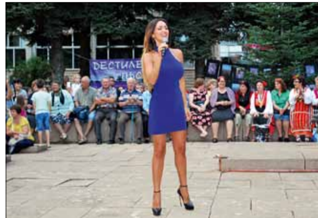
Глория беше гост на събитието през 2018 година. Кой ли ще бъде звездният участник през тази?

„За нашите гостоприемни, работливи и коректни приятели от Добруджа – в първите дни на жаркия месец юли очаквайте поредното издание на Фестивала, превърнал се в едно от емблематичните събития благодарение на вашето активно присъствие! Топ-звезда, ла-