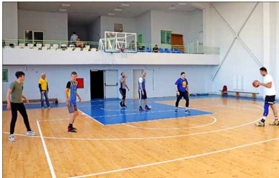
Турнирът по баскетбол 3x3 даде старт на Седмицата на спорта 2022.

Турнирът по баскетбол 3x3 се проведе в спортната зала на СУ „Никола Й. Вапцаров“ и продължи повече от четири часа, като в нея се включиха точно 60 любители на играта. Получи се интересно събитие, което за пореден път доказва, че баскетболът има традиции и бъдеще в нашия град.