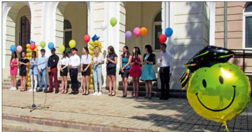
Това са абитуриентите от СУ „Никола Й. Вапцаров“.

Празничната атмосфера беше допълнена от богатата музикална програма, участие в която взеха ученици от учебното заведение за изпращане на своите завършващи приятели.