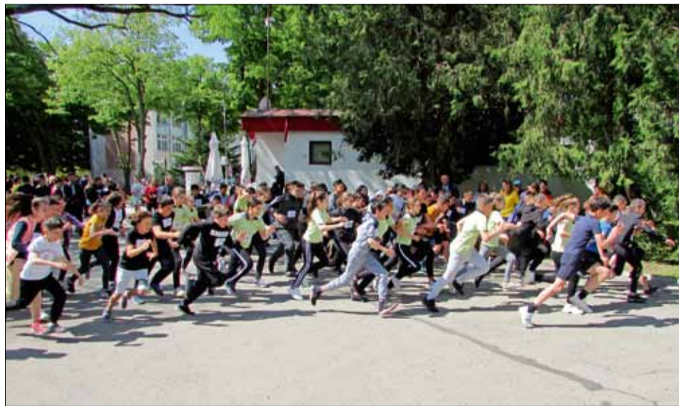
В марафона взеха участие над 300 деца и го превърна в най-масовото спортно събитие за годината.

Най-радвашото от този марафон беше фактът, че всички деца пристигнаха с огромно желание за участие, включиха се без притеснение в надпреварата и пробягаха цялото трасе, без значение дали са сред първите или сред последните. Външното беше огромно и въпреки че някои от децата видимо бяха уморени и тотално изтощени след дългото бягане, всички те изразиха желание отново да участват в подобен марафон.