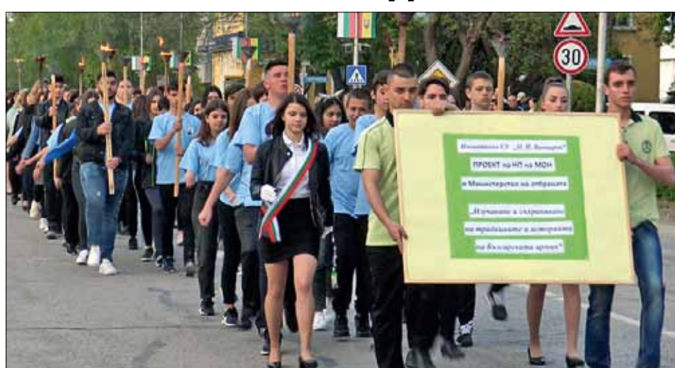
Факелното шествие на Гергьовден.

Програмата „Изучаване и съхраняване на традициите и историята на Българската армия“ се осъществява през учебната 2021/2022 година. Тя залага на патриотичното възпитание като част от обра-