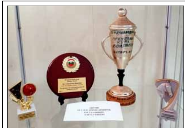
Исторически музей, град Генерал Тошево, обявява кампания по набиране на купи, медали, плакети, грамоти и всякакви трофейни предмети на спортните клубове в града и общината. Дарените предмети ще останат за бъдещите поколения в специално изграден кът на спортната слава и ще разказват за богатата история на спорта в нашия роден край.

Правителството уточнява, че по-голямата част от мерките ще бъдат уредени в предстоящата актуализация на бюджета в средата на настоящата година, като съответно бъдат предвидени различните срокове за влизане в сила и изпълнение. Ще бъдат изработени и необходимите законодателни промени.