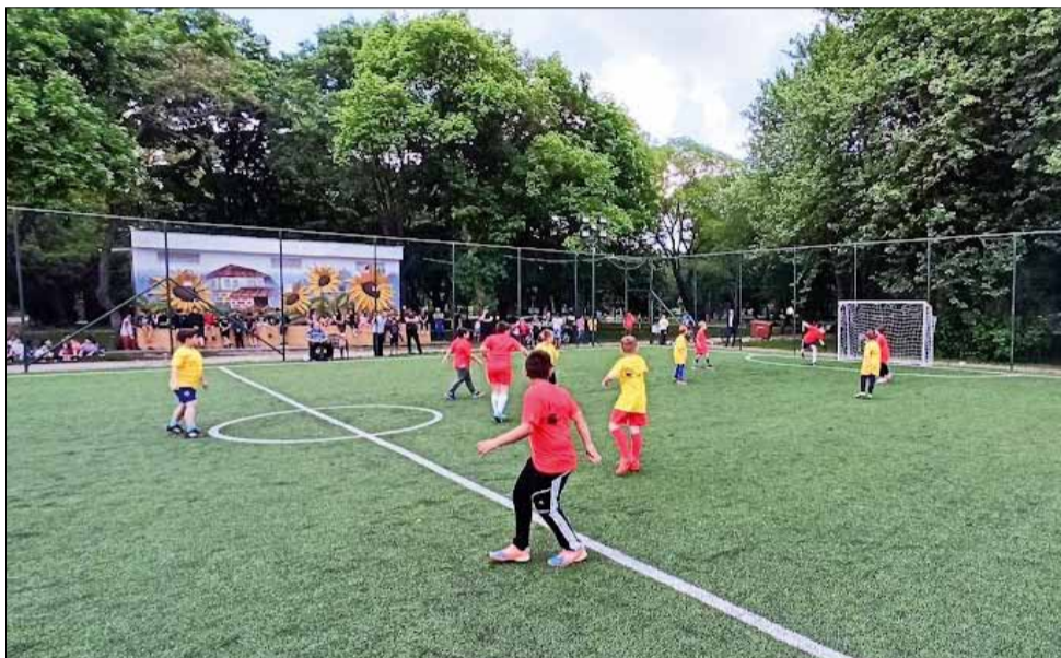
Учениците дадоха всичко от себе си на терена, защитавайки цветовете на своите училища.

Общо в турнира по футбол се включиха близо 60 деца. На всички има бяха раздадени тениски с логото на Седмицата на спорта. След двубоите всички получиха и призови медали. Като награда на тимове бяха подарени и професионални тренировъчни топки.