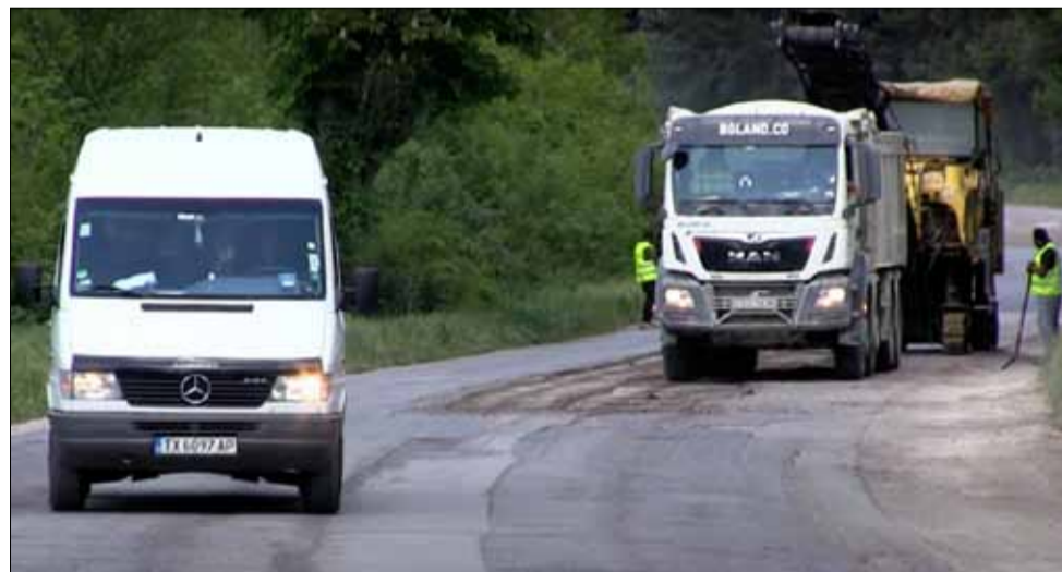
Отсечката ще бъде закърпена докато не започне същинската част от ремонта.

„В момента се прави всичко възможно ремонтът да бъде завършен, но това няма как да стане до края на май“, призна Георги Стратиев.