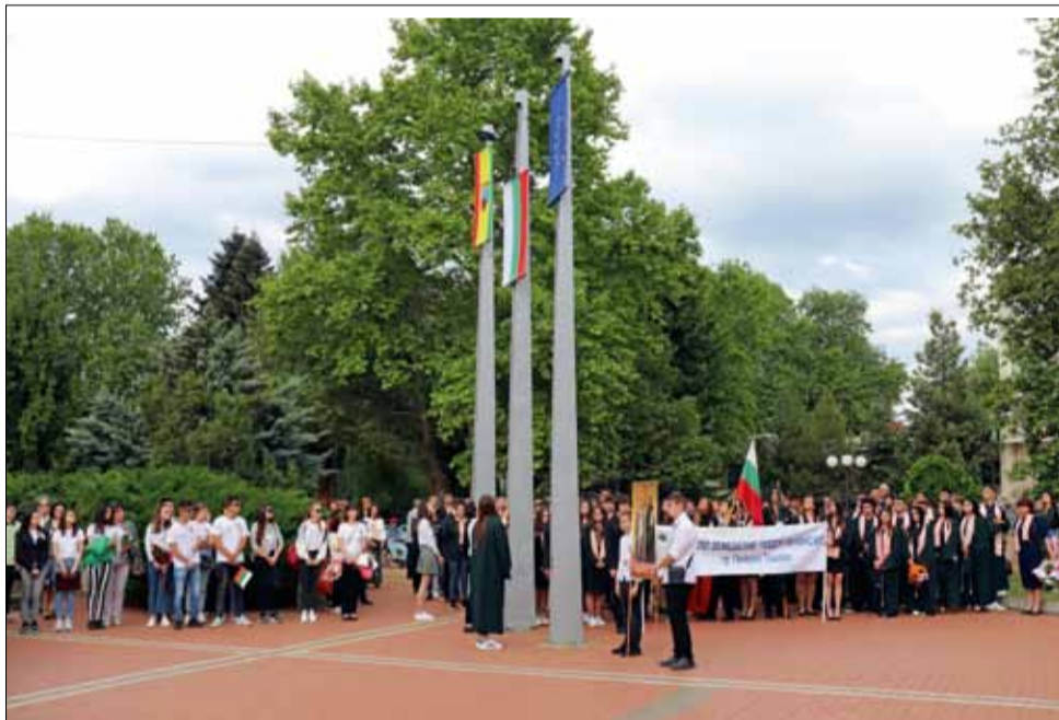
24 май – ден на българщината...

По традиция в Деня на българската просвета и култура и на славянската писменост в цяла България се провеждат празнични шествия и тържества. Празникът става официален през 1957 година, но отдаването на почит към делото на Кирил и Методий започва през далечната 1851 година, когато по инициатива на Найден Геров е проведена церемония в класното училище в Пловдив. От 1857 година празникът става традиционен за всички български училища.