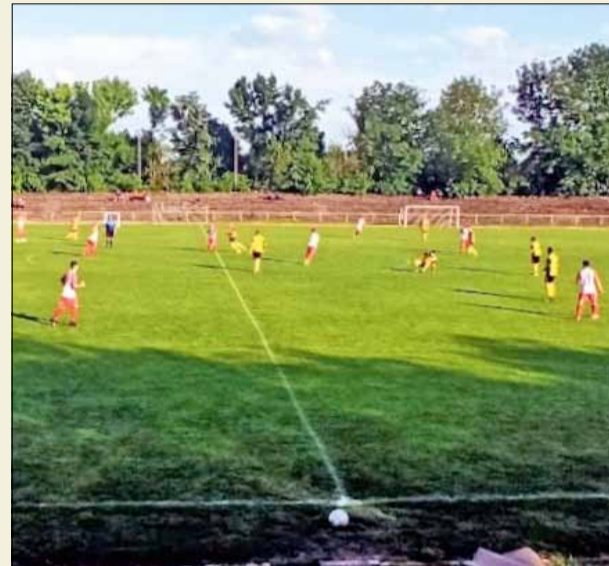
„Спортист 2011“ и „Ботев“ (Нови пазар) не успяха да си вкарат попадения.

на от първата. Играта стана хаотична. Отборът на „Ботев“ тръгна малко по-смело в атака, остави много празни пространства отзад и можеше да бъде наказан. „Спортист 2011“ организира няколко бързи контри, които при по-голяма съобразителност от страна на футболисти-