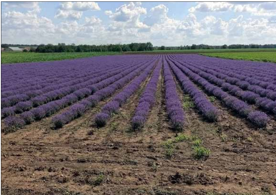
Поскъпването на горивата ще затрудни допълнително производителите на лавандулово масло.

ните на всички услуги по прибирането на реколтата ще се покачат, заради високите цени на горивата. От друга страна е процесът на изваряване и извличане на маслото. Той също ще се оскъпи тъй като масово дестилерите работят на газ, който поскъпна шоково през последните месеци. Производителите вече правят сметка, че дори изкупната цена да достигне 50-60 лева на килограм, това няма как да покрие разходите им и те ще фалират.