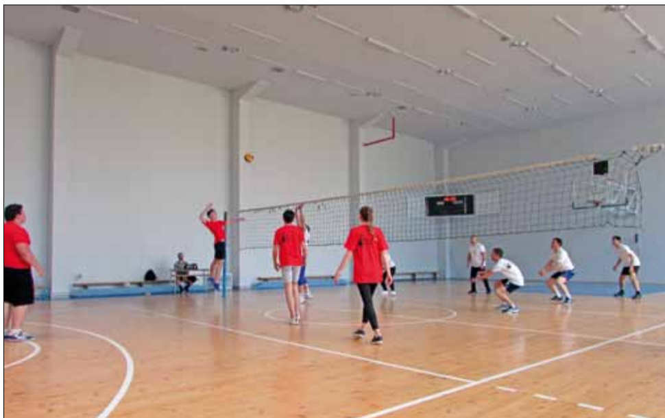
Демонстративният двубой по волейбол предложи много интересни моменти.

Децата все пак си заслужиха всичко това с желанието за игра и мотивацията. Заслужиха го и с безрезервната си помощ и подкрепа, която през цялата Седмица на спорта, продължила от 9 до 17 май оказаха на организаторите. Учениците се включиха активно в почти всички турнири, често пъти помагаша при провеждането на различните спортни мероприятия и най-вече показаха, че за тях спортът не е нещо „между другото“, останало на заден план някъде след телефоните и социалните мрежи, а основна част от техния живот.