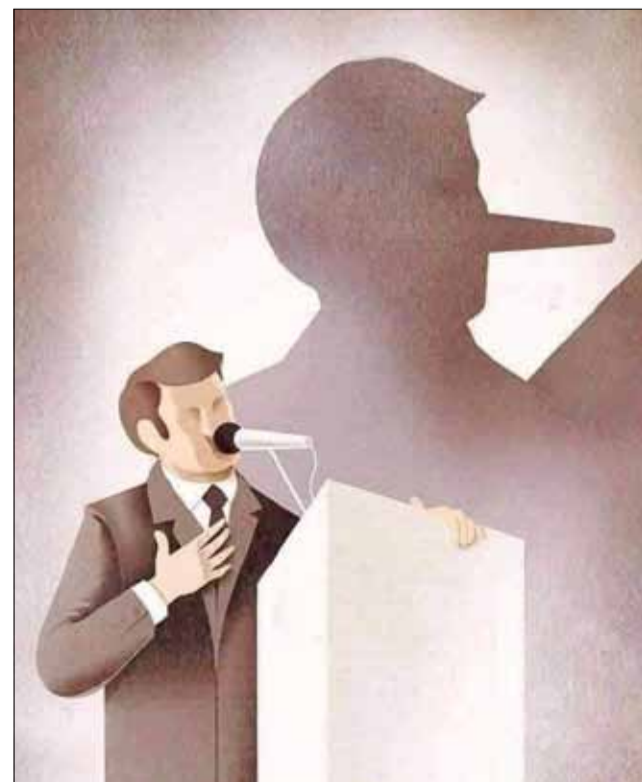
Колко позната родна картинка...

- Какво направихте, когато видяхте обвиняемата да удря съпруга си по главата с ютията? - Ами обадих се на годеницата си и й казах, че съм размислил и няма да се женим.