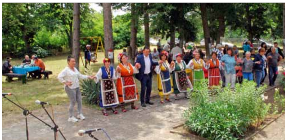
В двора на местното читалище жители и гости на село Балканци извиха кръшни хора и се отдадоха на сладка размисъл край трапезата.

За доброто настроение на всички се погрижиха музикантите от формация „Чар“, а няколко народни песни изпълниха самодейците от НЧ „Стефан Караджа – 1941“, село Чернооково. Събитийната програма започна с кръшно хоро, което се изви покрай масите, разположени под дебелия сянка в двора на местното читалище. Общинският кмет пък поздрави всички присъстващи, като им пожела да бъдат здрави, да продължават да се събират, да разказват на поколенията за своите родове и да носят в сърцето си китното село Балканци.