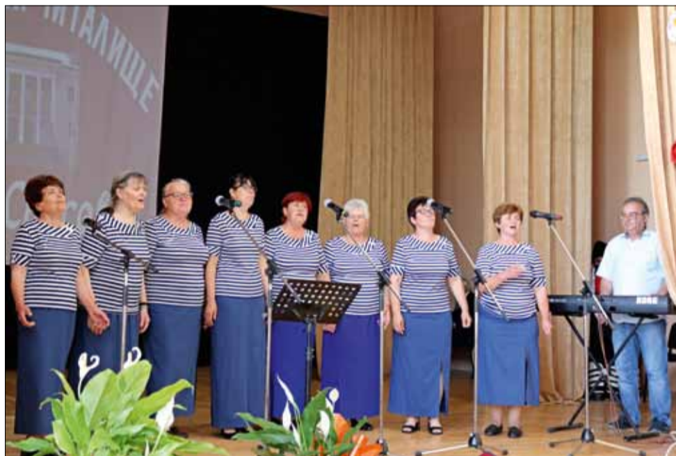
Домачините се постаряха да направят един незабравим празник.

Под вещото ръководство на преподавателите в академията, децата упражняваха своите таланти в апликирането и създаването на пана и картини, посредством различни техники. Благодарение на добилата напоследък техника чрез отпечатване, в един от дните „патиланците“ направиха цветна композиция. Рисуваха весели клоуни с широки усмивки, а в края на седмицата изучаваха тънкостите на маскиращата техника с тиксо.