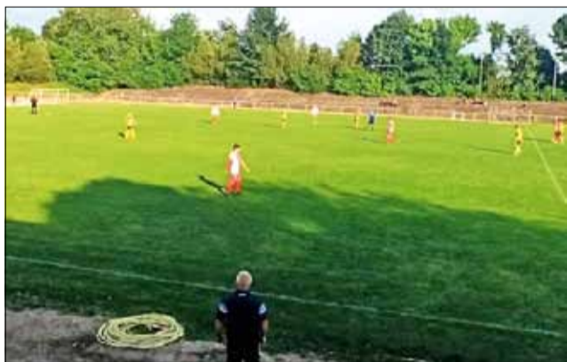
„Спортист 2011“ започва подготовка за новия сезон на 3 юли.

Отборът от град Генерал Тошево ще се събере официално за старт на лятната си подготовка в началото на месец юли. Целият подготовителен период ще премине