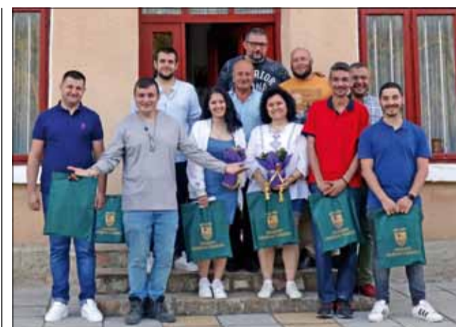
Снимка за спомен с всички участници.

По регламент вокалните групи представиха две песни с обща продължителност до шест минути, танцовите – две изпълнения с обща продължителност до 10 минути, а индивидуалните изпълнители – песен или танц с продължителност до три минути. Една от песните на вокалните групи задължително трябваше да бъде свързана или посветена на обичая Еньовден.