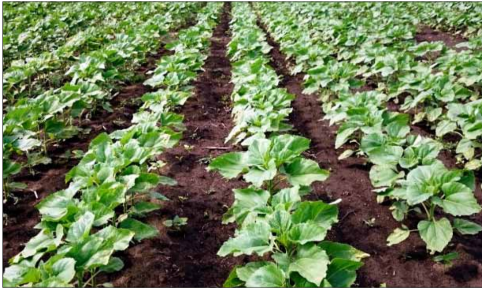
Зърнопроизводителите са доволни от състоянието на слънчогледа по полетата.