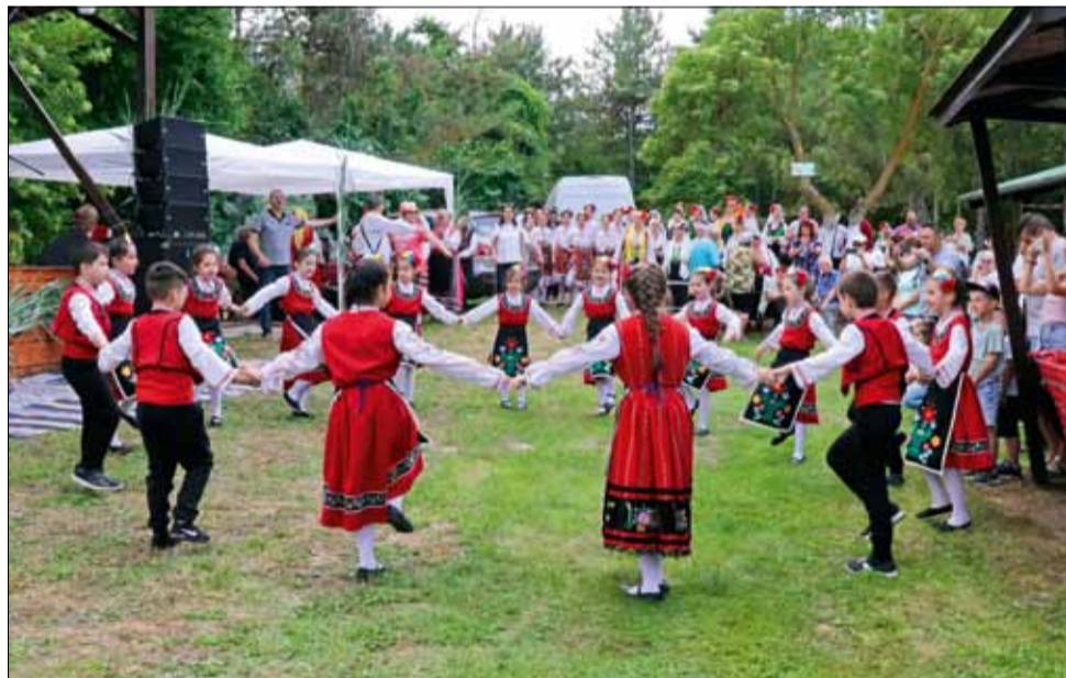
Радващо е, че толкова малки деца вземат участие на подобни фолклорни събори.

Фотосите ще могат да бъдат разгледани от жителите и гостите на град Генерал Тошево съвсем скоро. Снимките ще бъдат наредени на специална открита изложба на площад „Бялата лястовница“ в града по време на осмото издание на Национален фестивал на лавандулата, който ще се проведе на 1 и 2 юли.