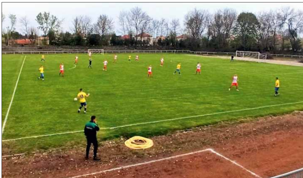
За „Спортист 2011“ предстои доста натоварено лято преди началото на новия футболен сезон в Трета лига.

Новото първенство ще започне в уикенда на 13 и 14 август, а в тези шест седмици подготовка, клубът е планирал пет контролни срещи, като само първата (за дата 6/7 юли) все още не е договорена. Останалите са срещу познати съперници, а мястото на провеждане на всеки приятелски двубой ще бъде уточнявано в последния момент. На 16/17 юли „Спортист 2011“ играе с юношите до 17-годишна възраст на „Черно море“ (Варна), на 23/24 юли е срещата със „Суворово“. В края на месеца – на 30/31 юли е контролата със „Септември 98“ (Тервел), а накрая е най-тежката и сериозна проверка – тази с отбора на „Добруджа“ (Добрич), който вече ще е започнал участието си в първенството на Втора лига. Мачът е предвиден за 3 август и по всяка вероятност ще се играе на стадион „Спортист“ в град Генерал Тошево.