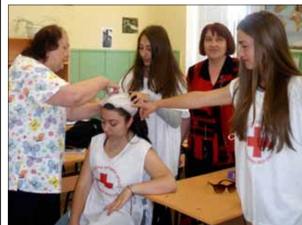
В края на учебната година Клуб „Български червен кръст“ в Иновативно Средно училище „Никола Йонков Вапцаров“, град Генерал Тошево, проведе редица обучения по оказване на първа помощ.