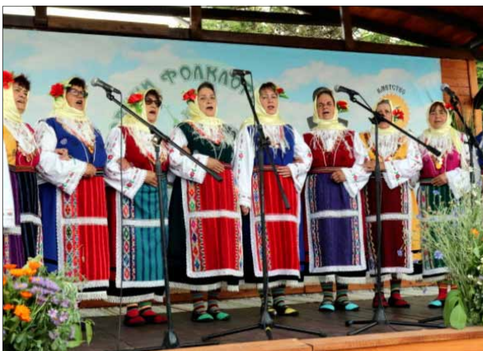
Съборът край язовир Дрян винаги е бил притегателно място за талантиливи самодейци, милеещи за родния фолклор.

Награда за Еньовски венец: НЧ „Възраждане – 1941“, село Одринци.