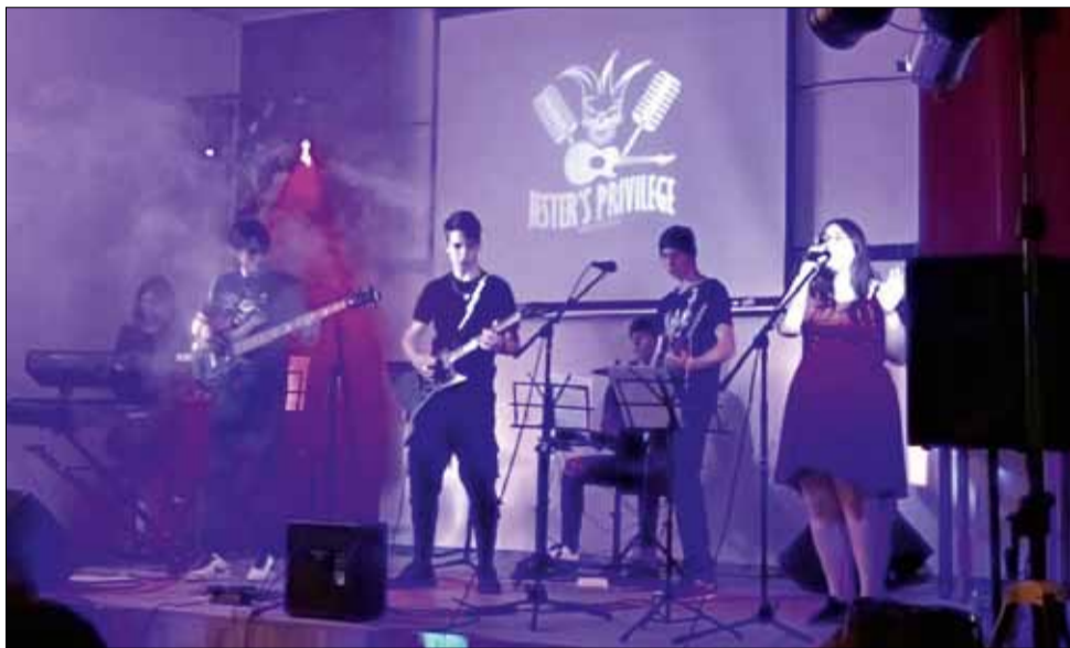
Възпитаниците на учебното заведение направиха страхотно впечатление с програмата, която бяха подготвили.