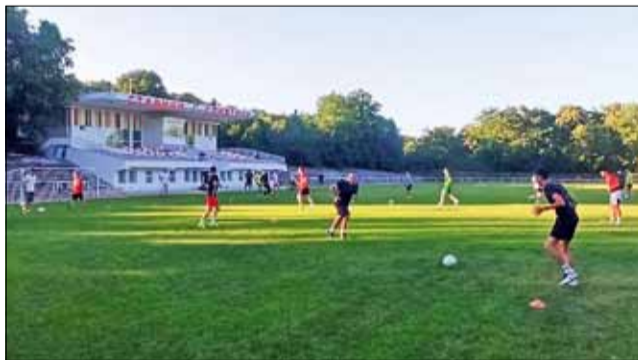
24 момчета се включиха в първото занимание на отбора преди началото на новия сезон.

Отборът ще тренира по три пъти седмично, а подготовката ще премине изцяло на клубната база в град Генерал Тошево.