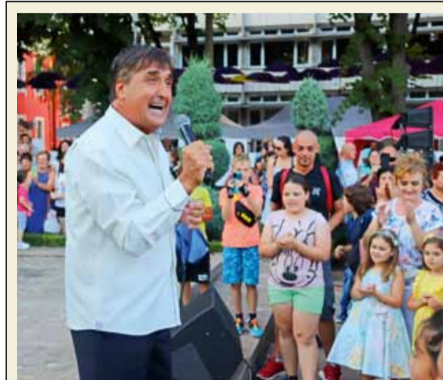
Незабравим концерт пред жителите и гостите на град Генерал Тошево изнесе популярният български певец Веселин Маринов. Той закри празничната програма на Националния фестивал на лавандулата с някои от най-незабравимите си парчета.

Осмото издание на Националния Фестивал на лавандулата се състоя в разгара на жътвената кампания на етерично-маслената култура в региона. Още около 24-25 юни земеделските производители влязоха в полетата, а горещото време след 28 юни даде старт на масовата жътва. През тази година, за разлика от последните две три, продукцията е добра, а добитото количество масло от декоративна лавандула варира между 10 и 12 килограма. Сега надеждите на всички са и изкупната цена на маслото да бъде адекватна.