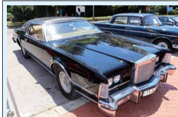
В рамките на осмият Национален фестивал на лавандулата, жителите и гостите на град Генерал Тошево имаха възможността да се насладят на десетки ретро-автомобили, които бяха изложени на импровизиран парад. Сред реставрираните по безупречен начин возила можеше да се види най-старият наличен модел в страната „Chevrolet International“, от 1929 г., „Lincoln Continental Mark 5“ и прословутият „Ford Mustang Shelby“.