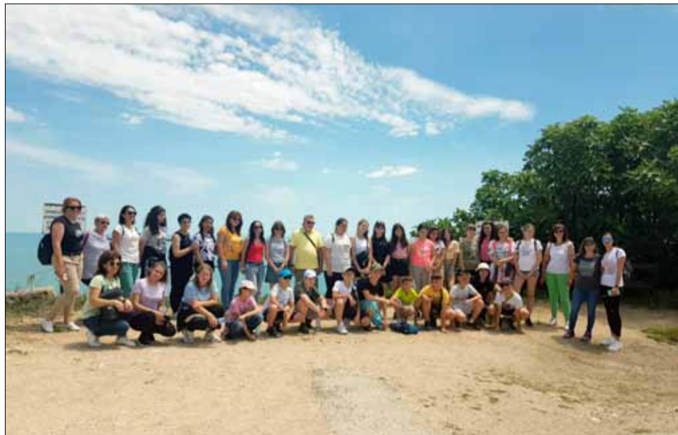
Тези срещи са полезни не само за учителите, които обменят добри практики, но и за децата, които създават нови приятелства.

Във връзка с изпълнението на Национална програма „Иновации в действие“ – „(из) Следвай и мечтай“ от 22 до 24 юни учители и ученици от ОУ „Христо Ботев“, град Черноморец, ИСУ „Св. Паисий Хилендарски“, село Скалица и