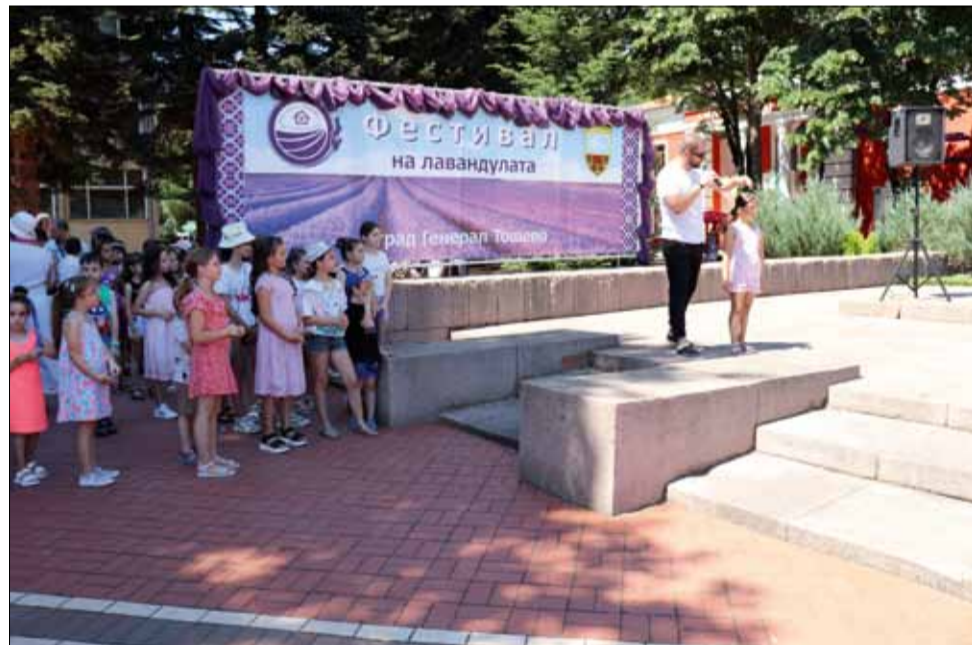
Още един незабравим Фестивал на лавандулата беше проведен в град Генерал Тошево. Двудневното събитие предложи за всекиго по нещо, но изглежда най-доволни останаха децата.