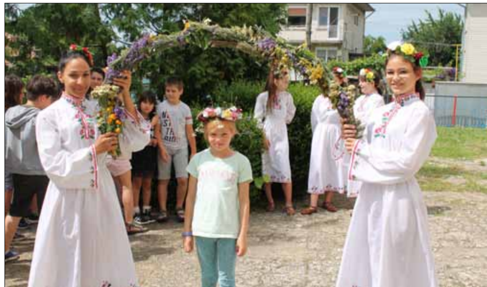
Малките патиланци пресъздадоха празника „Еньовден“.

Миналата седмица пък патиланците имаха образователен урок на тема „Различните деца“. Лекцията беше много полезна, защото всички научиха, че „различните“ деца не трябва да бъдат игнорирани, а точно напротив – да получават внимание, приятелско отношение и усмивка. Това, че обществото ги приема за различни, не означава, че те не обичат да играят, да танцуват, да пеят, да рисуват и да се смеят. Точно за това трябва да се общува с тях, да им се помага, а на детската площадка всички да играят заедно.