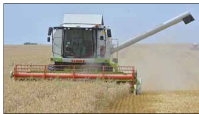
Добрят времеви прозорец позволява спокойно прибиране на продукцията това лято.

В същото време зеллата седмица в област Добрич масово започна пробно жънене на рапица, като очакванията са масово прибирането на културата да започне тази седмица. Същото се отнася и за пшеницата. През тази стопанска година земеделците очакват добиви от над 600 – 650 кг/дка при пшеницата. „Въпреки много добра, тъй като е майското засушаване всички очакват добри реколтата. Валежите