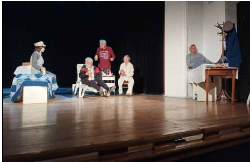
Постановката „Районна болница“ се игра два пъти пред публиката в град Генерал Тошево.