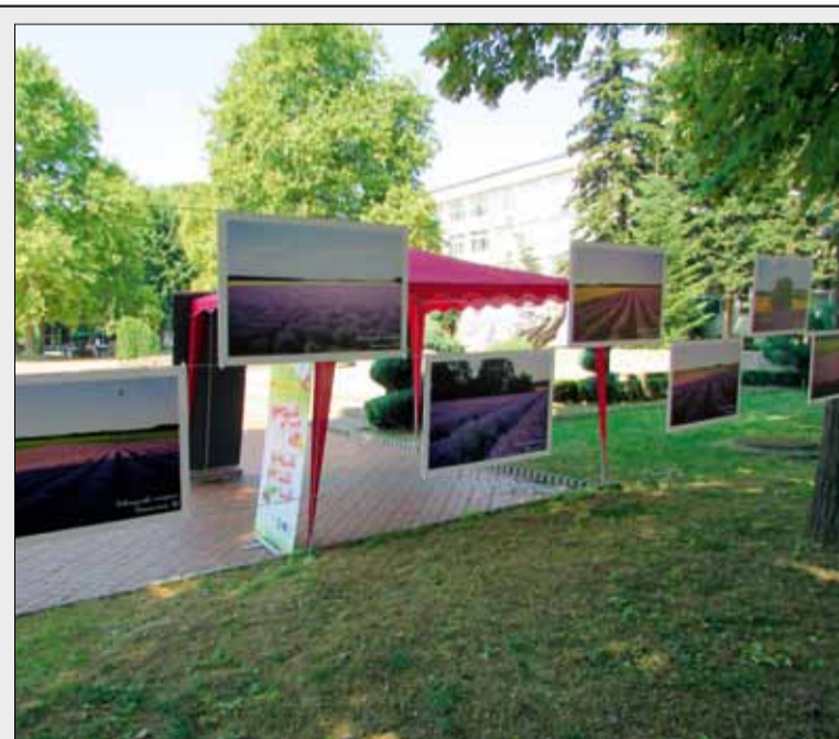
Прекрасните фотографии от пленера украсиха площад „Бялата лястовица“.

Пленерът ще приключи с традиционната изложба, която ще бъде наредена в НЧ „Светлина – 1941“, град Генерал Тошево и ще може да бъде разгледана през месеците юли и август.