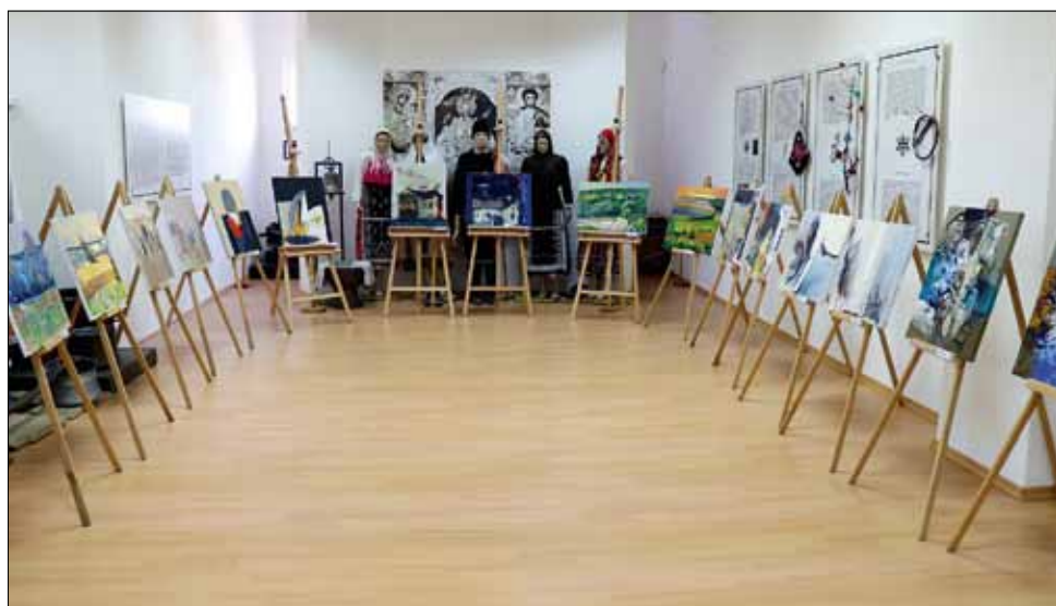
Всички картини могат да бъдат разглеждани до края на месец август в музея.

ни места край село Красен са майсторски изобразени на платната, показващи симбиозата между хубавите отминали времена, жизненото настояще и неизвестното и потайно бъдеще.