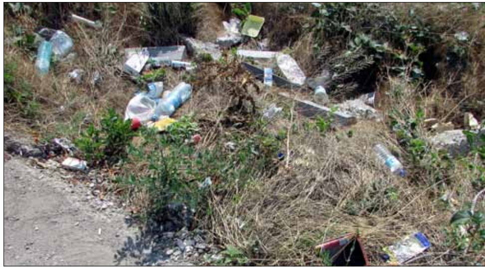
Опасната от тирове в посока границата с Румъния често започва от края на село Кардам.

Наред с всичко останало състоянието на самия път е плачевно. Но това вече не е тайна за никого. Редица подписки и протести продължават не дават никакъв резултат. Жителите на пограничните села вече нямат надежда и буквално не знаят, какво да предприемат. Трасето от Генерал Тошево до границата е като лунен пейзаж. Дупките отдавна са се превърнали в огромни кратери. На места, там където бяха положени бордюри в началото на дейностите по рехабилитацията на пътя, те вече ги няма, тъй като са изкъртени от камионите, които отбиват за престой на границата. На ЖП-надлеза между Генерал Тошево и село Кардам пък вече се вижда арматурата. Асфалт отдавна няма. Лошото е, че всичко това продължава прекалено дълго, а потърпевши са най-вече жителите на нашата община.