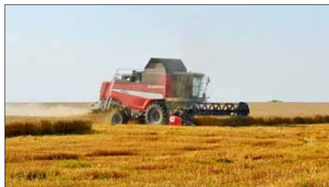
Хубавото време осигурява спокойно и безпроблемна жътва.

Обичайно добивите са високи край морето, въпреки че и там е доста шарено. В региона на Шабла има регистрирани по-ниски добиви – към 400-500 кг./дка, на други места край морето пък стигат до над 700 кг./дка. Във вътрешността на областта също е много пъстро – на места 400 кг./Тервел/, на места – до 700 кг. В Генерал Тошево и Крушари добивите засега са 500-600 кг.