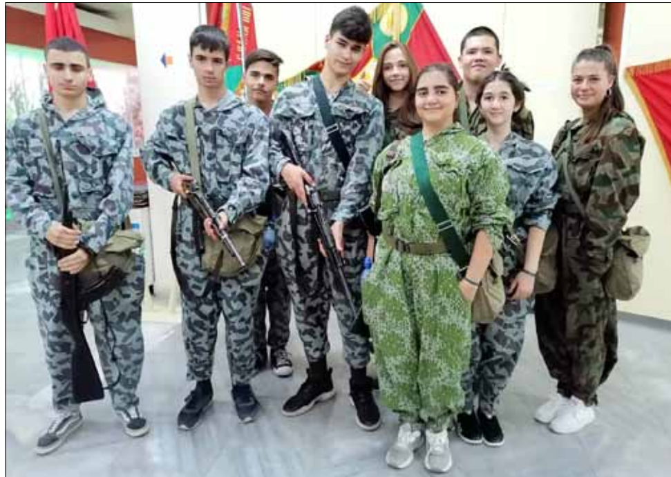
Възпитаниците на СУ „Никола Й. Вапцаров“ позират с военните си униформи малко преди стрелковото учение.

В края на обучението всички получили сертификати за успешно завършен курс, а победителите в състезанието по лидерска подготовка бяха наградени с грамоти.