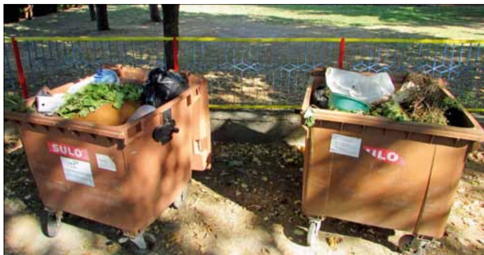
Кафявите контейнери редовно се пълнят с всякакви видове отпадъци.