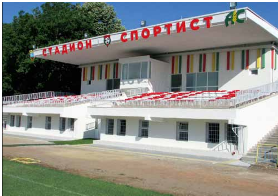
Ето така изглежда обновената сграда на стадион „Спортист“ в града.

„Спортист“ придаде на сградата нов и модерен облик, а централната трибуна и новите седалки осигуряват максимален комфорт на местните привърженици. Част от тях вече са убедиха в това по време на първата контрола от лятната подготовка на „Спортист 2011“ с тима на „Дулово“.