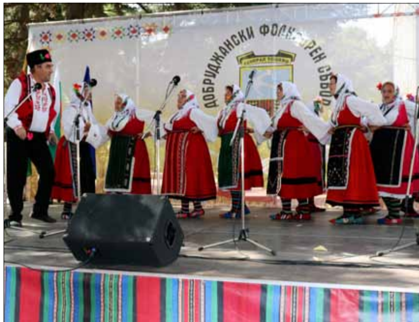
Журито призна, че всички участници са се представили на много високо ниво и тяхното оценяване е било изключително трудно.

Клуб на пенсионера „Добруджански глас“, град Добрич – за отлично представяне във всички категории;