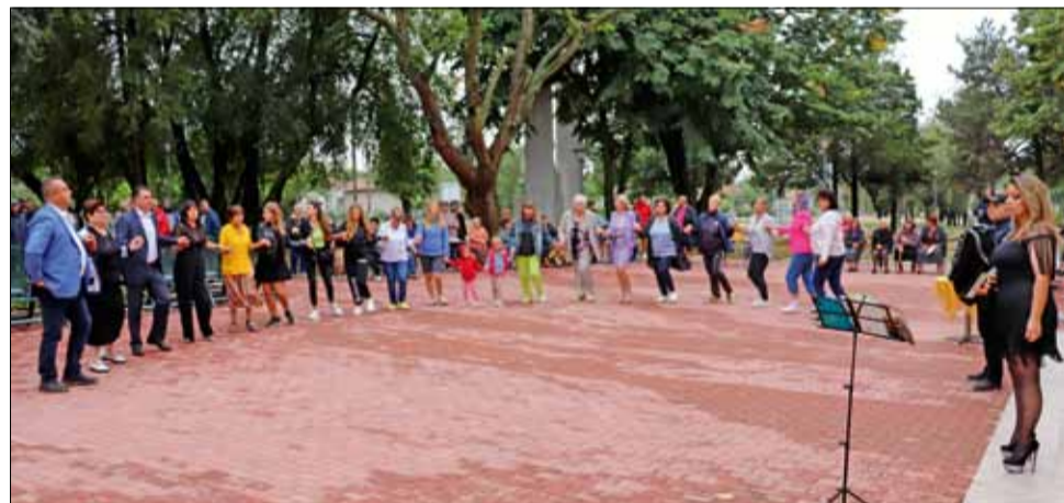
Дълги хора и отрупани сергии с най-различни продукти белязаха Празника на плодородието „Кардамска есен“.