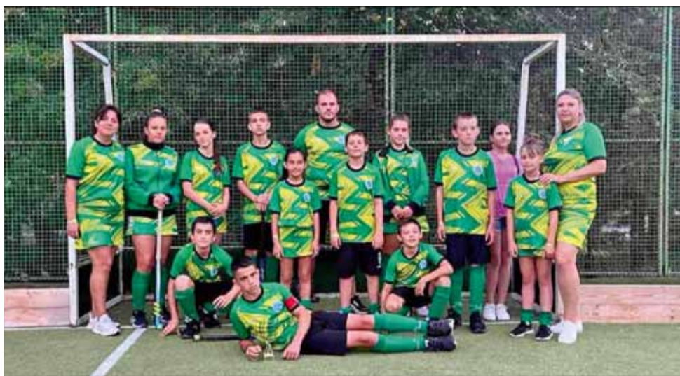
Отборът на КХ „Стик – ГТ“, който участва с две възрастови групи на силния турнир в Албена.

Цялото спортно събитие се проведе при отлична организация и даде началото на есенният кръг на турнирите по хокей – открито, които са подготовка за финалните държавни първенства през месец октомври.