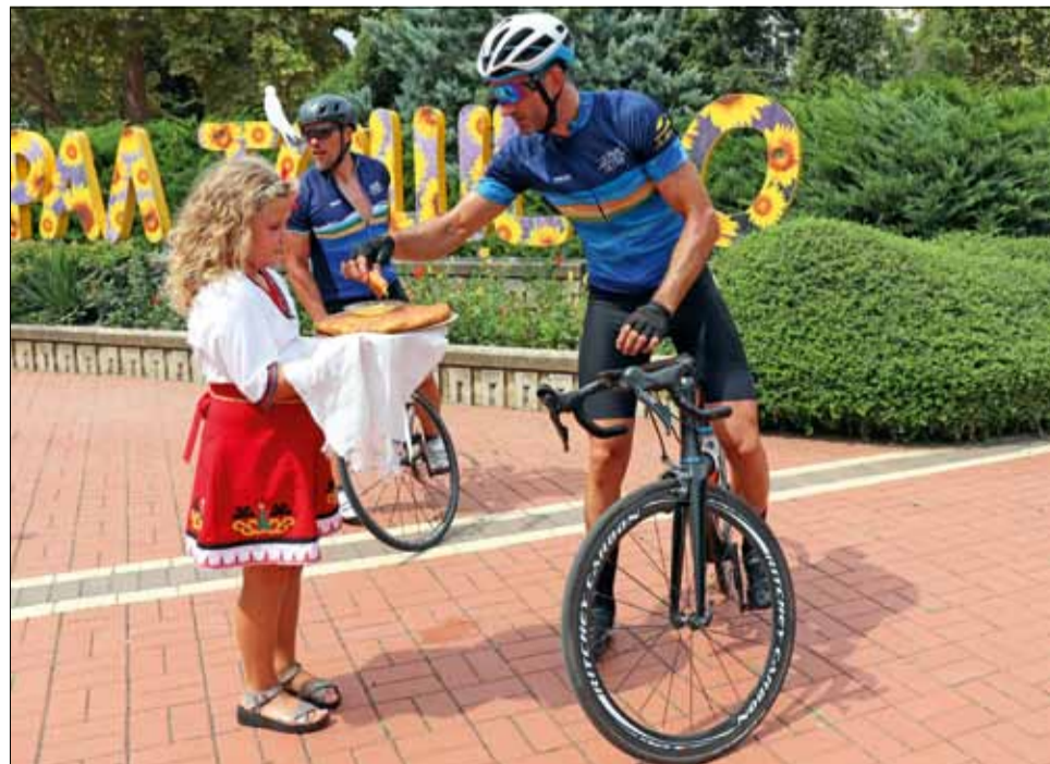
Най-бързите колоездачи от „Дунав Ултра“ преминаха през града ни 29 часа след своя старт в град Видин, подкрепиха се със содена питка и мед и продължиха към финала.

Тази година събитието предизвика огромен интерес и включваше рекорден брой Общини. Събитието се проведе с подкрепата на Министерство на Туризма и общините: Видин, Оряхово, Долна Митрополия, Гулянци, Никопол, Белене, Две Могили, Русе, Силистра, Генерал Тошево и Шабла.