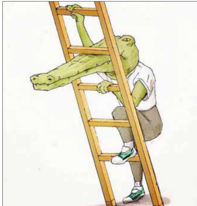
Понякога голямата ти уста, може да ти донесе единствено неприятности...