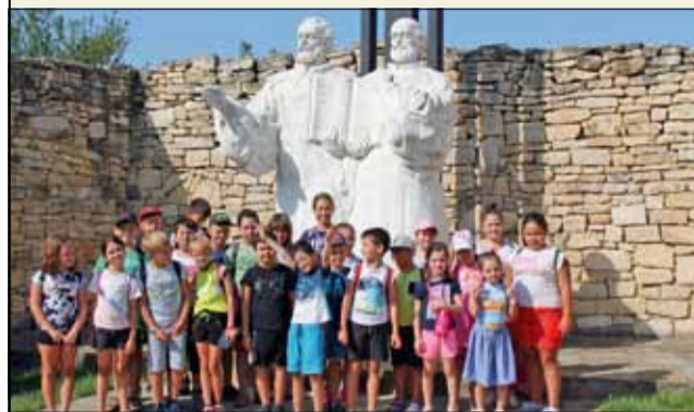
Малките патиланци изпращат поредното незабравимо лято.

Най-вълнуващото лятно приключение за децата от община Генерал Тошево приключи. С интересно и образователно посещение до Националния историко-археологически резерват „Плиска“ и „Дворът на кирилицата“ в град Плиска, което се състоя на 31 август, Лятна академия „Патиланци“ официално затвори врати.