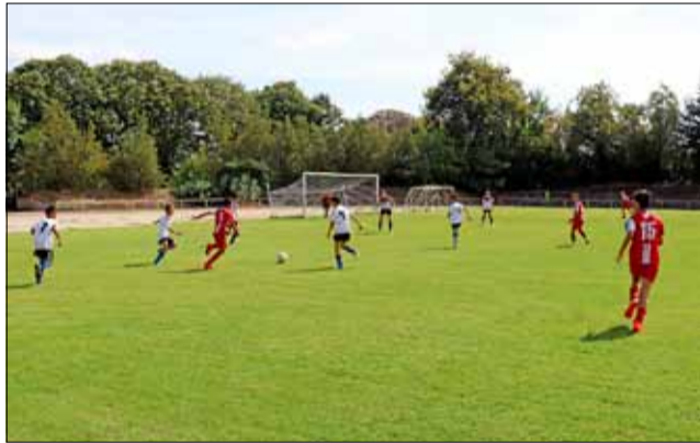
Младешките на „Спортист 2011“ победиха „Аксаково“ в контролна среща, която трябваше да бъде официална...

Защо трябваше ли? Ами защото децата и от двата тима излязоха на терена в уречения час и бяха изпълнени с желание за игра, но ръководните органи на Зоналния съвет на БФС в град Добрич бяха забравили да изпратят съдии, които да ръководят тази среща... Скандално е мека дума, която би описала ситуацията, но за съжаление такава е цялостна-