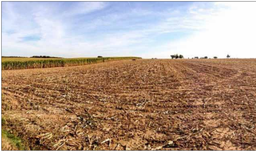
Цените на нивите в Добруджа вече минават психологическата граница от 4000 лева на декар.