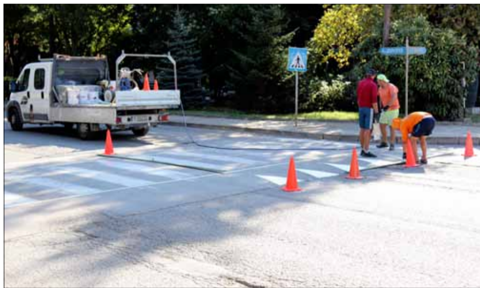
Преди началото на есенно-зимния сезон пътната маркировка в града се освежава.

Палас“, на ул. „Трети март“ ното запазване на белотата. Покрива и критериите на Агенцията „Пътна инфраструктура“ Освежават се и надписите в началото на пешеходните пътеки „Погледни“, което има за цел да създаде пешеходни навици у по-малките участници в движението.