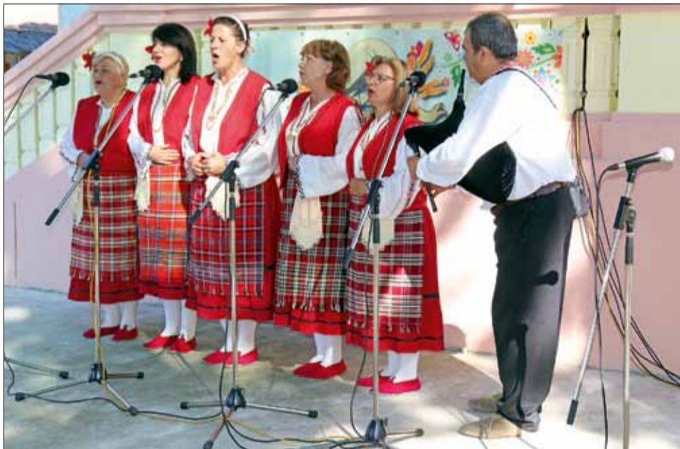
В село Пчеларово се получи хубав празник, на който присъстваха много хора, обичащи българската народна музика.

Дълго след края на събитието хората останаха в градинката на читалището в селото и продължиха да се забавляват с песни и хора, както и на сладка размисъл на пейките и край масите. На 6 септември село Пчеларово празнува и своя празник и поради тази причина много хора продължиха с празненствата дълго след фолклорния събор.