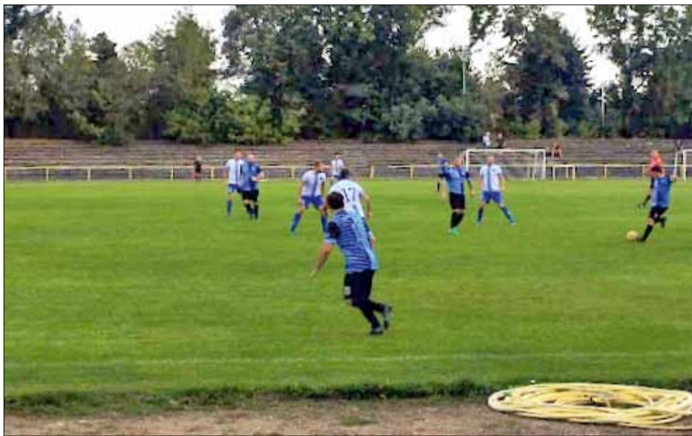
„Спортист“ и „Калиакра“ изиграха хубав двубой, който за съжаление беше спечелен от гостите от Каварна.

В следващия кръг отборът на „Спортист“ гостува на „Орловец 2008“, „Дружба“ ще пътува до село Стожер за среща с местния „Хр. Ботев“, а „Партизан“ ще почива.