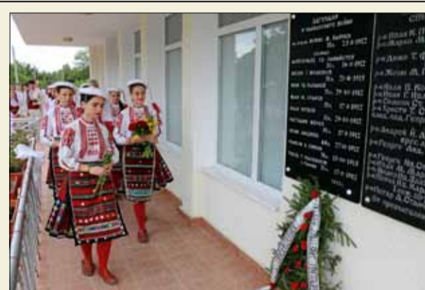
В памет на героите ...