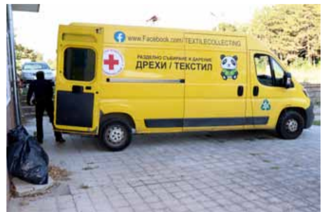
Само през 2022 година вече са предадени близо 5 тона текстил.

На 8 септември Община Генерал Тошево направи третото за 2022 година предаване на дрехи за рециклиране. Текстилните изделия бяха събрани от двата специални контейнера, които са разположени на територията на града и предадени за благотворителни кампании. Последното предаване на дрехи беше на 26 май, когато бяха събрани 1 200 кг. текстилни продукти за рециклиране. Сега, само четири месеца по-късно, цифрата е още по-внушителна. Предадените дрехи бяха