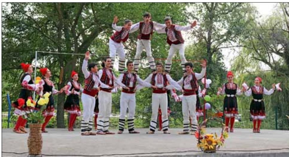
На празничния 6 септември своя събор отпразнува село Изворово.

„Чар“ се грижеше за доброто настроение на всички присъстващи, а спонсори на събитието осигуриха курбан, който беше раздаден за здраве и берекет.