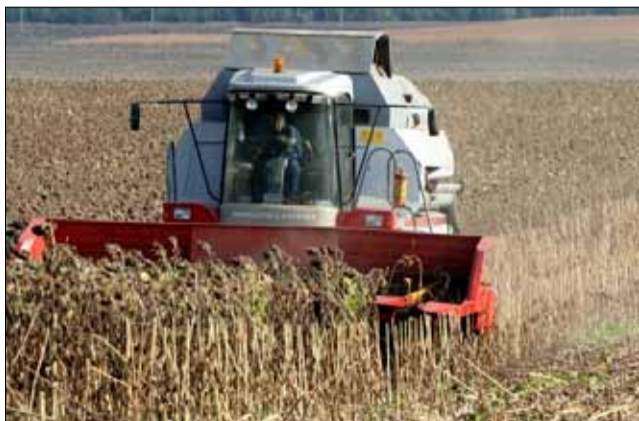
Земеделските стопани не са доволни от добивите от слънчоглед през тази година.

по-слаби от миналогодишните. Като причина се изтъкват нападенията на ливадната переперуда и засушаването.