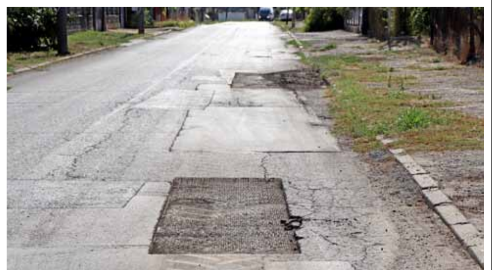
През последните десетина дни в град Генерал Тошево се извършват дейности по изкърпването на улици. Ремонтните работи са по улиците: „Димитър Благоев“, „Васил Априлов“, „Патриарх Евтимий“, „Опълченска“, „Георги С. Раковски“ и „Ал. Стамболийски“. Общата дължина на изкърпените участъци е около 470 м 2 . Дейностите ще продължат с цялостно преасфалтиране на две улици в град Генерал Тошево – „Марица“ (с дължина от 180 м.) и „Струма“ (с дължина от 100 м.).

Според първоначалната информация, пожарът е възникнал вследствие на не изгасен фас от цигара. По случая е образувано досъдебно производство.