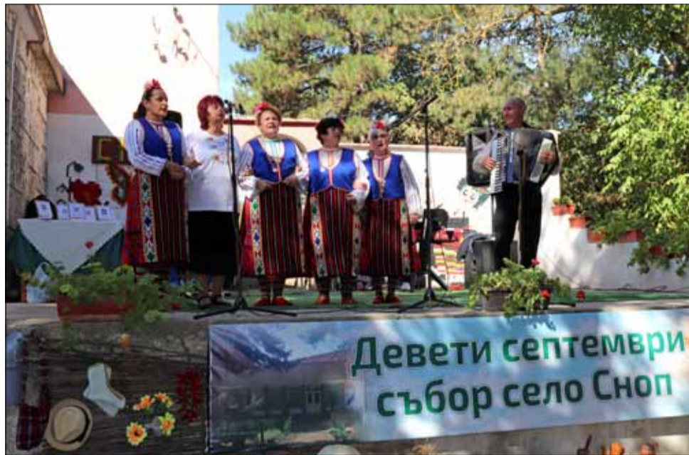
В село Сноп мални и големи се веселиха, пяха и играха хора.

самите гости на тържеството. Съборът продължи с изпълненията на оркестър „Мега“ от град Добрич, които свириха дълго време за радост на всички присъстващи.